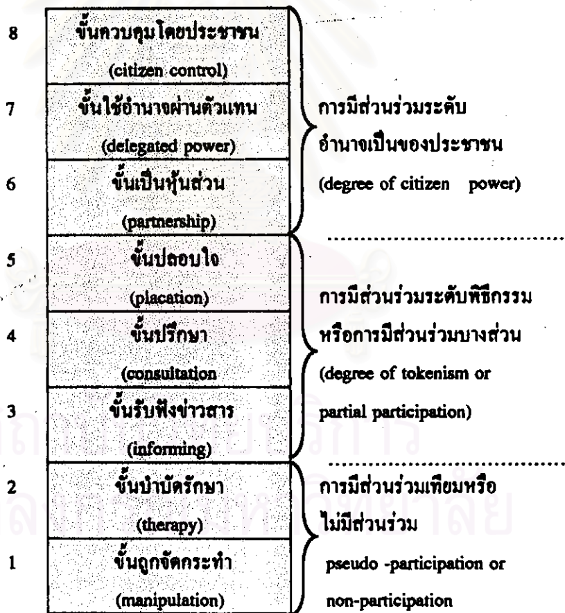
แผนภาพที่ 1 บันไดของการมีส่วนร่วม 8 ขั้น ของอาร์นสไตน์