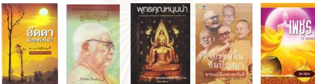
ภาพประกอบที่ 3 ภาพหนังสือธรรมะอื่นๆ

ในส่วนของอวัจนภาษาที่ปรากฏในงานของท่าน ทั้งปก ภาพประกอบ สีสัน ขนาดตัวอักษร การจัดสรรหน้ากระดาษ ขนาดรูปเล่ม ล้วนเป็นส่วนสำคัญที่ทำให้งานของท่านน่าสนใจ และมีความแตกต่าง จากหนังสือธรรมะอื่น ซึ่งมักปรากฏเป็นรูปถ่าย หรือรูปวาดพระพุทธรูป พระสงฆ์ หรือบางเล่มก็ใช้ภาพวิจิตรทัศน์เป็นภาพปกและภาพประกอบภายใน ซึ่งไม่น่าดึงดูดใจ สำหรับผู้อ่านที่เป็นวันเด็กหรือวัยรุ่น เหล่านี้ล้วนเป็นปัจจัยที่ทำให้หนังสือธรรมะกับผู้อ่านมีช่องว่างที่ห่างกันมากขึ้น