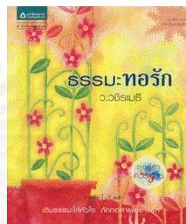
ภาพประกอบที่ 2 ภาพหนังสือธรรมะของท่าน ว.วชิรเมธีที่จัดพิมพ์โดย สำนักพิมพ์อมรินทร์

กระดาษที่สำนักพิมพ์อมรินทร์เลือกใช้เป็นกระดาษถนอมสายตา (Green Read) เทคนิคการพิมพ์ การตั้งค่าโปรย การทำตัวหนา เหล่านี้สามารถสร้างความแตกต่างให้กับรูปเล่มของหนังสือธรรมะได้ชนิดที่หลุดจากรอบเดิม ซึ่งเนื่องมาจากการที่สำนักพิมพ์อมรินทร์วางกลยุทธ์ในการจัดทำหนังสือธรรมะ และกำหนดกลุ่มเป้าหมายที่ต่างไปจากเดิม กล่าวคือ สำนักพิมพ์ต้องการขยายกลุ่มเป้าหมายของผู้อ่านหนังสือธรรมะให้สามารถอ่านได้ทุกช่วงวัย ทั้งวัยรุ่น วัยทำงาน และผู้สูงอายุ จึงออกแบบรูปเล่มที่ทันสมัย สดใสจนกลายเป็นการพลิกมิติใหม่ของหนังสือธรรมะ และเป็นเอกลักษณ์ของหนังสือธรรมะของสำนักพิมพ์อมรินทร์