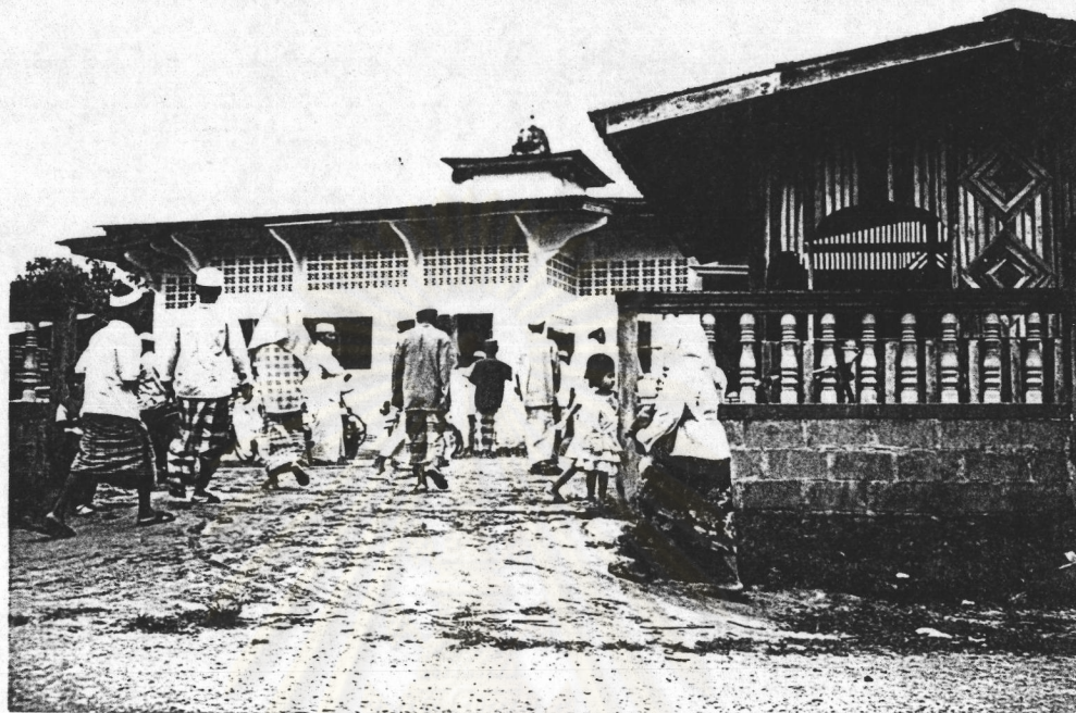
ภาพที่ 5 แสดงมัสยิดศูนย์รวมทางศาสนาและกิจกรรมของชุมชนปัตตานี