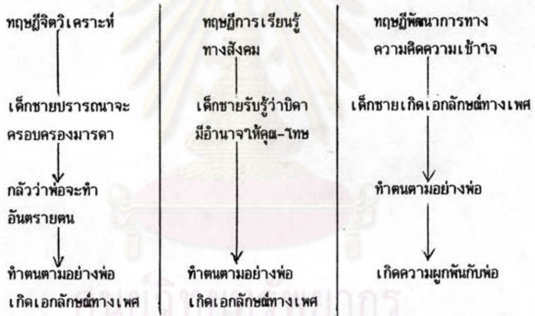
แผนภูมิที่ 1 แสดงการเปรียบเทียบขั้นตอนของพัฒนาการด้านบทบาททางเพศของเด็กชายตามแนวทฤษฎีจิตวิเคราะห์ ทฤษฎีการเรียนรู้ทางสังคมและทฤษฎีพัฒนาการทางความคิดความเข้าใจ (ดัดแปลงมาจาก อีระพร อุวรรณโณ, 2526 : 339)

จากทฤษฎีทั้งสามที่ได้กล่าวมาแล้ว เมื่อนำมาเปรียบเทียบกันพบว่า พัฒนาการของการเกิดบทบาททางเพศในทฤษฎีจิตวิเคราะห์นั้น เกิดจากการถอดแบบ (Identification) บิดามารดาที่มีเพศเดียวกันกับเด็ก เนื่องจากมีความรักและการต้องการครอบครองบิดามารดาที่มีเพศตรงข้ามกับตน ส่วนทฤษฎีการเรียนรู้ทางสังคมนั้นจะเป็นการเรียนรู้โดยสังเกตตัวแบบในสภาพแวดล้อมและผลที่เกิดจากการกระทำนั้น ถ้าเกิดผลดีเด็กจะเลียนแบบพฤติกรรมนั้น ถ้าเกิดผลเสียก็จะละเว้นไม่แสดงพฤติกรรม ในทฤษฎีพัฒนาการทางความคิดความเข้าใจเน้นความสำคัญของวุฒิภาวะทางปัญญา เมื่อเด็กเรียนรู้ว่าตนเป็นเพศใด และรู้ว่าเพศของตนคงที่จะเริ่มเรียนรู้ที่จะแสดงบทบาทที่สังคมเห็นว่าเหมาะสมกับเพศของตน เพื่อรักษาไว้ซึ่งเอกลักษณ์ทางเพศที่ตนมี จากการเปรียบเทียบดังกล่าว นำมาแสดงเป็นแผนภูมิได้ดังต่อไปนี้