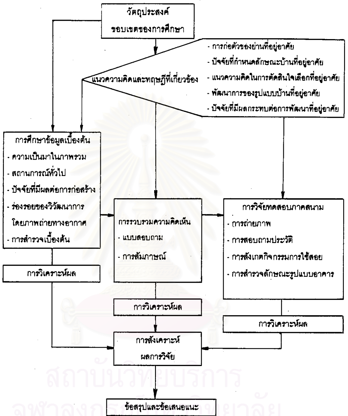
แผนภูมิแสดงขั้นตอนการในการศึกษา