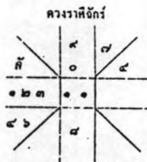
ดวงราศีจักร เกิดวันพุธที่ ๒๗ กรกฎาคม ๒๕๓๐ ปีขาล จ.ศ. ๑๓๐๐ โศภณ พจนานุกรม ๑๕.๑๕ น. จังหวัดศรี