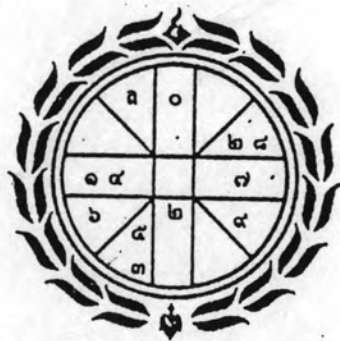
ดวงชะตา พท.อ.สุจินดา คราประยูร เกิดวันที่ ๖ พฤศจิกายน พ.ศ.๒๕๓๖ อาทิตย์ ๑๕ ค่ำปีระกา ลัคนาสถิตย์ราศีพฤษภ เทศาภิแห่งตุษ เขาลือกันให้แซกว่าเกิดเวลาเสือ