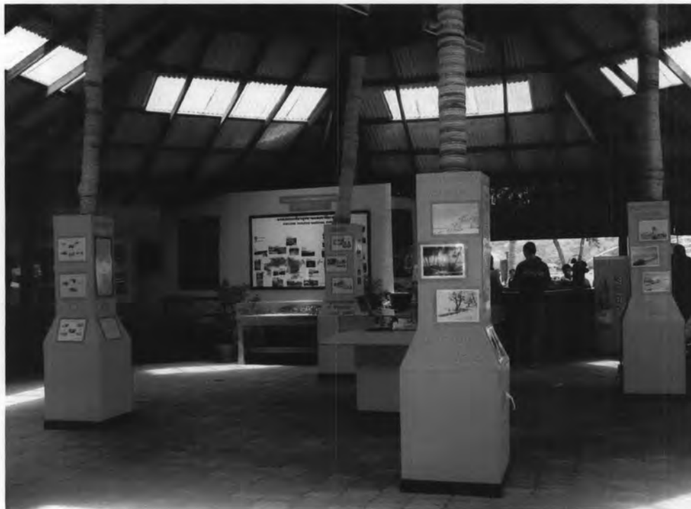
ห้องนิทรรศการ