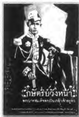
ภาพที่ 29 ภาพพระบาทสมเด็จพระปิ่นเกล้าเจ้าอยู่หัว

ดังจะเห็นได้จากเจ้านายหลายพระองค์ที่นิยมมีนักดนตรีไว้ในอุปถัมภ์ อาทิเช่น พระบาทสมเด็จพระปิ่นเกล้าเจ้าอยู่หัวพระอนุชาในพระบาทสมเด็จพระจอมเกล้าเจ้าอยู่หัว ซึ่งทรงดำรงตำแหน่งพระอิสริยยศเป็นกรมพระราชวังบวรสถานมงคล (วังหน้า) ในสมัยนั้น ทรงมีวงดนตรีส่วนพระองค์ที่เข้มแข็งมากที่สุด ในสมัยนั้น