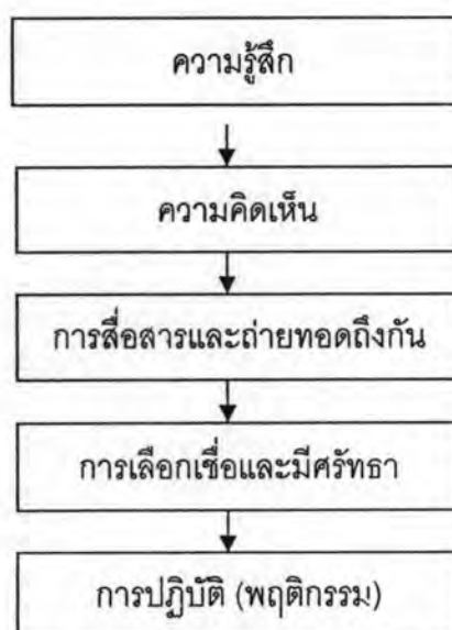
แผนภูมิ แสดงกระบวนการเกิดจิตสำนึกหรือความสำนึก

เมธี ปิรันธนานนท์ (2526: 42-48) ได้อธิบายถึงกระบวนการการเกิดจิตสำนึกหรือความสำนึกว่าความสำนึกจะเกิดขึ้นอย่างเป็นกระบวนการดังแผนภูมิที่แสดงไว้นี้