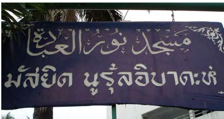
ภาพประกอบที่ 1 แสดงป้ายชื่อหน้ามัสยิดนูรุลอิบาดะห์

พื้นที่ในการศึกษาครั้งนี้ คือ พื้นที่บริเวณโดยรอบมัสยิดนูรุลอิบาดะห์ หรือชุมชนสุเหร่า บึงหนองบอน โดยพื้นที่ในการศึกษาจะมีมัสยิดนูรุลอิบาดะห์ ตั้งอยู่เป็นศูนย์กลางของชุมชน ซึ่งมัสยิดนั้นตั้งอยู่ที่ 43 หมู่ 11 ซอยอ่อนนุช 70 แขวงประเวศ เขตประเวศ กรุงเทพมหานคร และผู้วิจัยใช้เป็นพื้นที่ในการเข้าไปศึกษาประชากรในกลุ่มตัวอย่าง