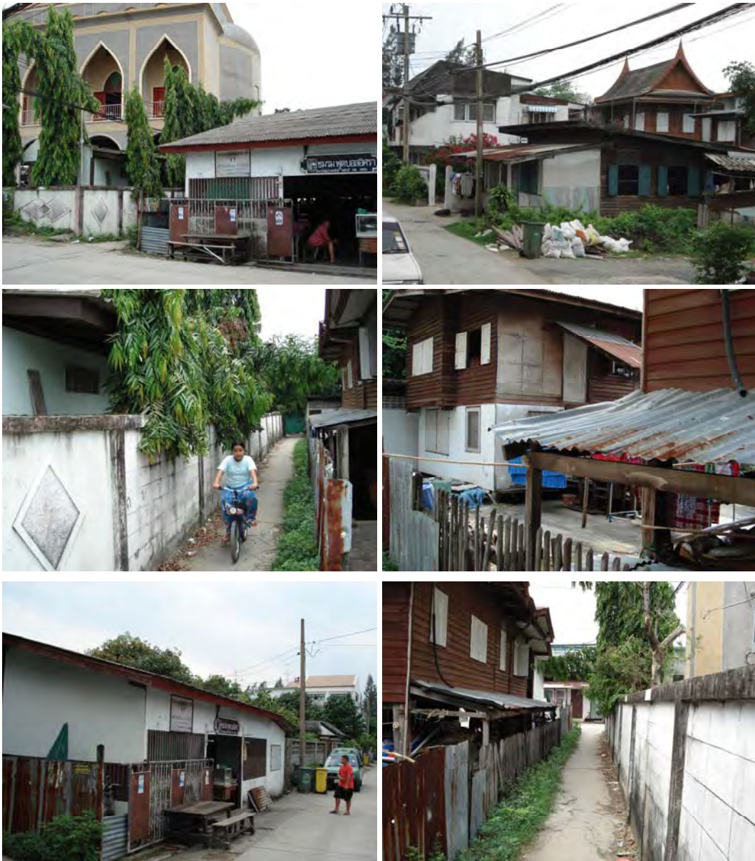
ภาพประกอบที่ 3 แสดงพื้นที่โดยรอบชุมชนสุเหร่าบึงหนองบอน