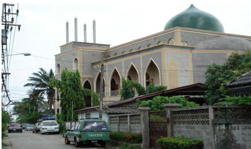
ภาพประกอบที่ 2 แสดงที่ตั้งของมัสยิดนูรุลอิบาดะห์