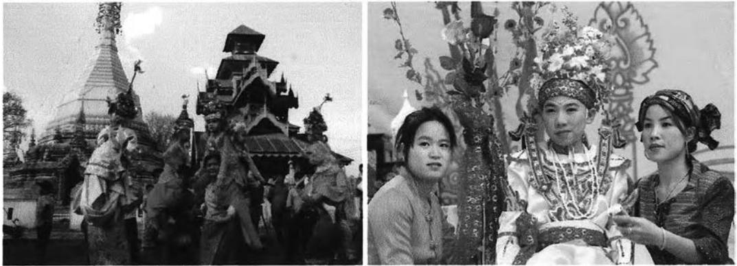
รูปที่ 1.1 แสดงลักษณะทางสถาปัตยกรรมและขนบธรรมเนียมประเพณีไทยใหญ่

ชุมชนบ้านปางหมู เป็นชุมชนไทยใหญ่แห่งแรกก่อนการสร้างเมืองแม่ฮ่องสอน ที่ผู้คนในชุมชนยังคงรักษามรดกทางวัฒนธรรมที่สืบทอดต่อกันมาอย่างยาวนานเอาไว้ โดยมีสถาบันเก่าแก่หรือองค์กรชุมชนดั้งเดิม ที่เกิดขึ้นจากพื้นฐานทางวัฒนธรรมไทยใหญ่ดั้งเดิม ความเชื่อในพระพุทธศาสนา ยึดมั่นในขนบธรรมเนียม จารีตและประเพณีไทยใหญ่ที่ได้รับการถ่ายทอดมาอย่างยาวนาน โดยมีผู้นำอาวุโสที่ได้รับการยอมรับจากผู้คนภายในชุมชนเป็นตัวประสานและเชื่อมโยงความสัมพันธ์ของผู้คนในการทำกิจกรรมต่างๆ ตลอดจนการจัดระเบียบชุมชน จึงทำให้ชุมชนบ้านปางหมูยังคงรักษามรดกทางวัฒนธรรมชุมชนไทยใหญ่เอาไว้ ทั้งในด้านการตั้งถิ่นฐานของชาวไทยใหญ่ ที่จะคำนึงถึงเรื่องของแหล่งน้ำและพื้นที่เกษตรกรรมเป็นสำคัญ เพราะน้ำและพื้นที่เกษตรกรรมเป็นปัจจัยหลักในการดำเนินชีวิต (อรศิริ ปาณินท์ ,2540 :11) รูปแบบของศาสนสถานและเจดีย์ทรงไทยใหญ่ที่สร้างตามความเชื่อระหว่างพระพุทธศาสนากับสิ่งเหนือธรรมชาติ ลักษณะบ้านพักอาศัยที่เป็นแบบไทยใหญ่ดั้งเดิม ที่มีการปลูกพืชสวนครัวบริเวณโดยรอบพื้นที่ตัวบ้าน ซึ่งเป็นการสะท้อนให้เห็นถึงวิถีชีวิตของผู้คนในชุมชนที่ยังคงมีความผูกพันกับธรรมชาติและสภาพแวดล้อมตลอดเวลา รวมไปถึงการสืบทอดขนบธรรมเนียมประเพณีไทยใหญ่ดั้งเดิมหรือประเพณีหย่าสี่สิบสองเอา ซึ่งเป็นประเพณีเกี่ยวกับวิถีชีวิตชาวไทยใหญ่ในรอบสิบสองเดือนเอาไว้อย่างสมบูรณ์ จากการทำที่ผู้คนในชุมชนบ้านปางหมูมีการจัดการทางด้านมรดกทางวัฒนธรรมภายในชุมชนของตน จึงทำให้ชุมชนบ้านปางหมู เป็นชุมชนเมืองแห่งเดียวของจังหวัดแม่ฮ่องสอนที่ยังคงรักษามรดกทางวัฒนธรรมชุมชนไทยใหญ่ไว้ได้อย่างชัดเจนและสมบูรณ์