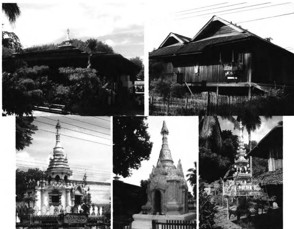
รูปที่ 1.2 แสดงลักษณะทางสถาปัตยกรรมที่พบภายในพื้นที่ชุมชนไทยใหญ่บ้านปางหมู

ดังนั้นจึงมีความสนใจที่จะศึกษา การจัดการมรดกทางวัฒนธรรมชุมชนไทยใหญ่บ้านปางหมู จังหวัดแม่ฮ่องสอน โดยอ้างอิงแนวคิดระบบนิเวศวิทยาชุมชน ซึ่งเป็นแนวคิดที่ให้ความสำคัญที่กลมกลืนระหว่างมนุษย์ที่เป็นชุมชนกับสภาพแวดล้อม โดยมนุษย์ใช้กระบวนการทางสังคมและวัฒนธรรมในการจัดการ เพื่อสืบทอดและรักษามรดกทางวัฒนธรรมให้คงอยู่ตั้งแต่อดีตจนถึงปัจจุบัน (อานันท์ กาญจนพันธุ์, 2543 : 301) มาเป็นแนวคิดหลักในการศึกษา เพราะเชื่อว่าระบบนิเวศวิทยาหรือสภาพแวดล้อม จะทำให้เข้าใจถึงลักษณะการดำเนินชีวิตของผู้คนในชุมชน รวมทั้งกลไกและกระบวนการทางสังคม ตลอดจนกิจกรรมต่างๆ ที่ก่อให้เกิดการสืบทอดและรักษามรดกทางวัฒนธรรมชุมชนไทยใหญ่บ้านปางหมูให้คงอยู่ เพื่อเป็นแนวทางในการป้องกันและสนับสนุนส่งเสริมให้วัฒนธรรมไทยใหญ่ดั้งเดิมของชุมชนบ้านปางหมูแห่งนี้ดำรงอยู่ต่อไป ก่อนที่วัฒนธรรมไทยใหญ่ดั้งเดิมเหล่านี้จะมีการสูญหายไปอย่างเช่นชุมชนไทยใหญ่อื่นๆ