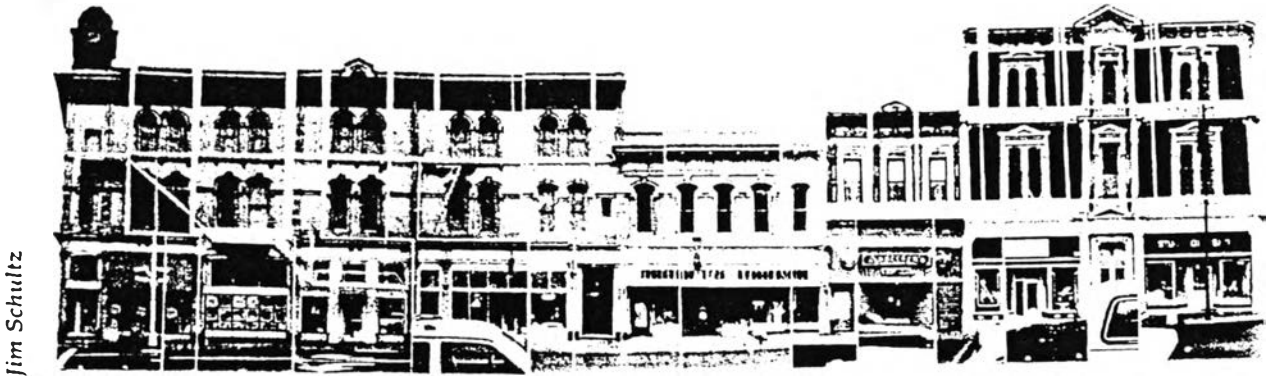
Create a photo montage.