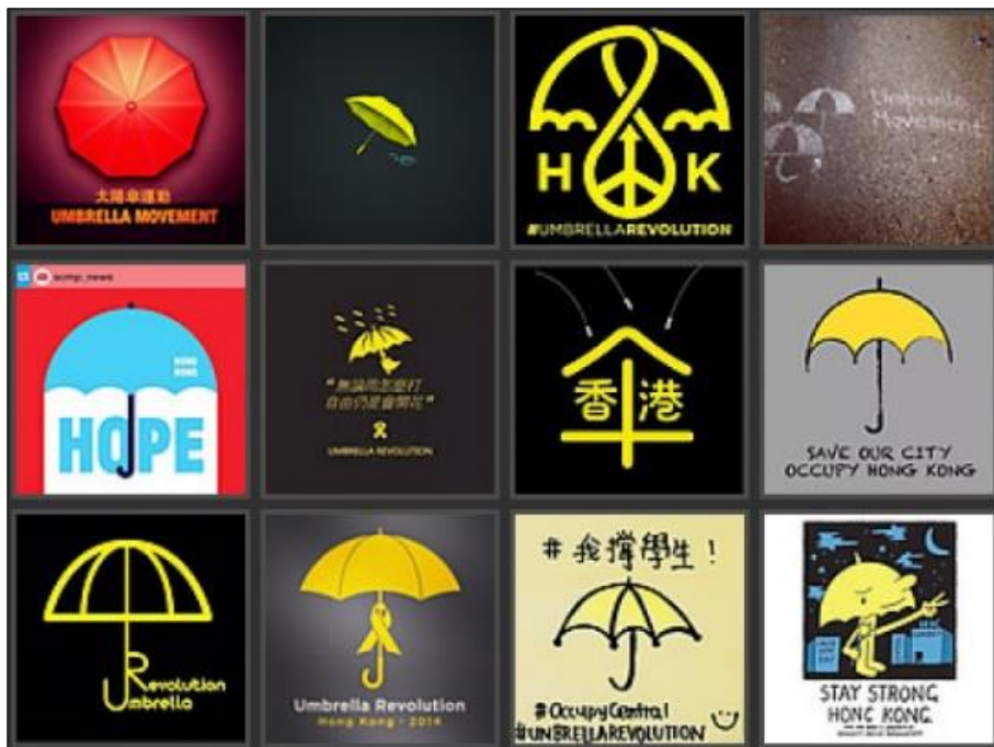
ภาพมีมสัญลักษณ์รูปร่ม วิกิพีเดีย (http://dismagazine.com/blog/67287)