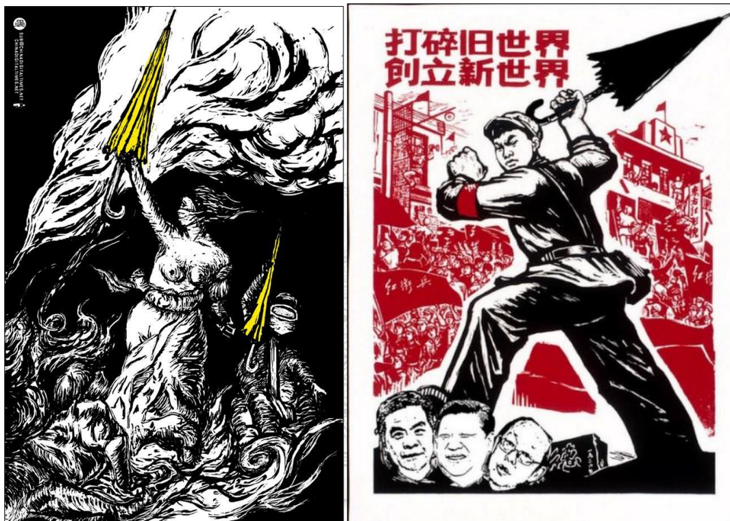
ภาพ Liberty Leading the People ( https://twitter.com/badiuca/ )

ประธานาธิบดีสาธารณรัฐประชาชนจีน ผู้ริเริ่มนโยบายการปฏิวัติวัฒนธรรม (cultural revolution) เป็นเหตุให้มีผู้เสียชีวิตจำนวนระหว่าง 750,000 ถึง 1,500,000 คน ห้วง ค.ศ. 1968-1971 65 การใช้มีมในลักษณะนี้สามารถสะท้อนความรู้สึกไม่พอใจที่รุนแรง หลังจากที่ตำรวจปราบจลาจลในฮ่องกง ตัดสินใจใช้แก๊สน้ำตาในการสลายการชุมนุม ทำให้ผู้เข้าร่วมขบวนการมีความรู้สึกโกรธแค้นและแสดงออกผ่านมีมที่แพร่หลายบนสื่อสังคมออนไลน์ 66