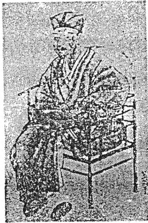
มะทซึโอะ บะโฌ