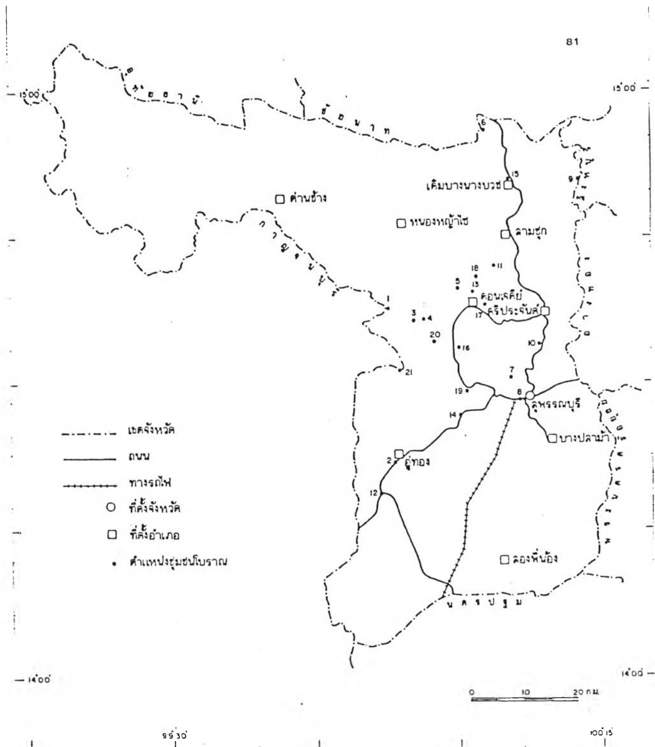
5.1 แผนที่แสดงตำแหน่งที่ตั้งชุมชนโบราณ จังหวัดสุพรรณบุรี (63)

LOCALITY MAP ANCIENT SETTLEMENTS: CHANGWAT SUPANBURI