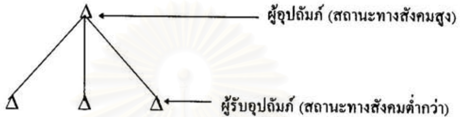
(โครงสร้างระบบอุปถัมภ์แบบกลุ่ม Patronage-client cluster)

โครงสร้างความสัมพันธ์กลุ่มผู้อุปถัมภ์ในแนวดิ่ง หมายถึงผู้อุปถัมภ์มีสถานะในสังคมสูง และให้การอุปถัมภ์ผู้ที่มีสถานะทางสังคมต่ำกว่า ดังภาพ