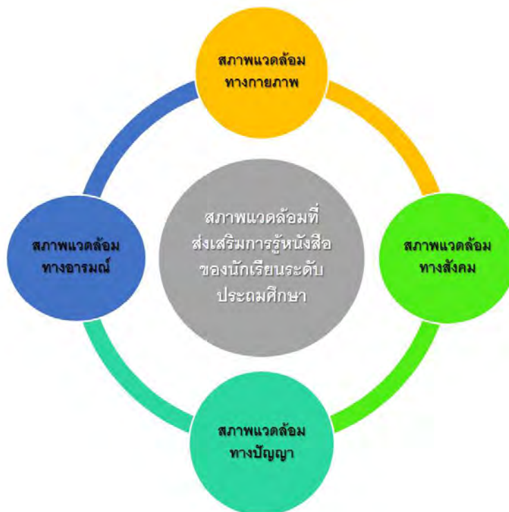
แผนภาพที่ 5.1 รูปแบบการจัดสภาพแวดล้อมที่ส่งเสริมการรู้หนังสือสำหรับนักเรียนระดับประถมศึกษา