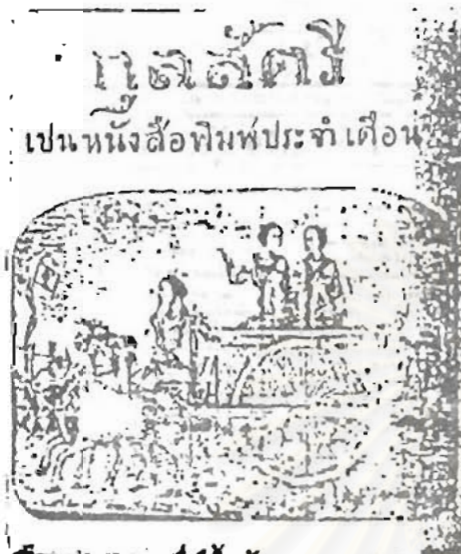
นิตยสารกุลสตรี รายเดือน เป็นนิตยสารผู้หญิง รุ่นแรกออกจำหน่าย ระหว่าง พ.ศ.2449-2450

ยุคของการปลูกสำนึกในด้านการให้ความรู้และสิทธิของสตรีไทย