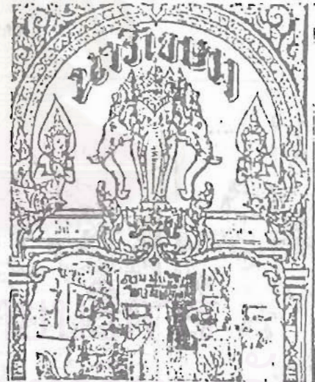
นิตยสาร นารีเชรม รายทศ เจ้าของ: ม.ล.หญิงสวาสดี ศิริวงษ์ ณ อยุธยา ปีที่เริ่มออก 2467