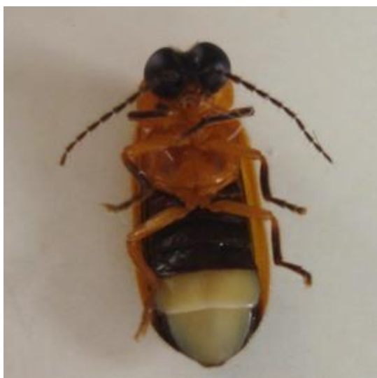
รูปที่ 4 ภาพแสดงหิ่งห้อยตัวเต็มวัยชนิด Luciola terminalis (เพศผู้)