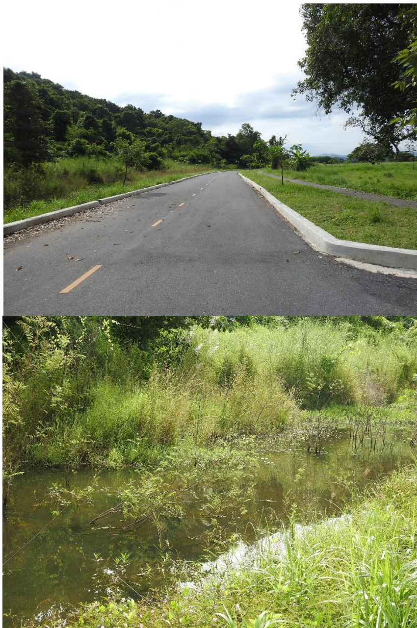
รูปที่ 7 ภาพแสดงแนวถนนช่วงทางขึ้นสันเขื่อนและบึงน้ำขนาดเล็กที่พบทิ้งห้อยในช่วงหัวค่ำจำนวนพอสมควร ในพื้นที่โครงการพัฒนาที่ดินสระบุรีจุฬาลงกรณ์มหาวิทยาลัย อำเภอแก่งคอย จังหวัดสระบุรี