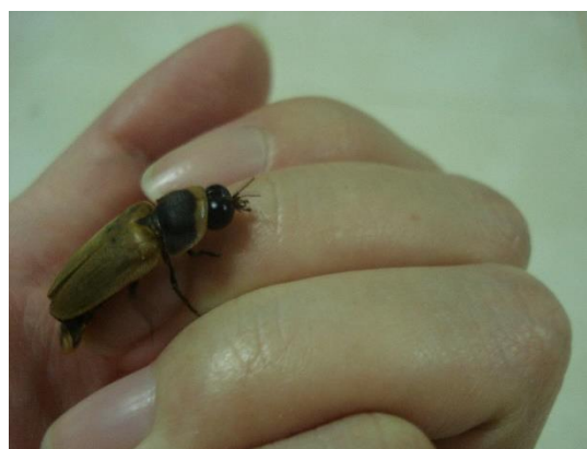
รูปที่ 3 ภาพแสดงหิ่งห้อยตัวเต็มวัยชนิด Lamprigera sp. (เพศผู้)