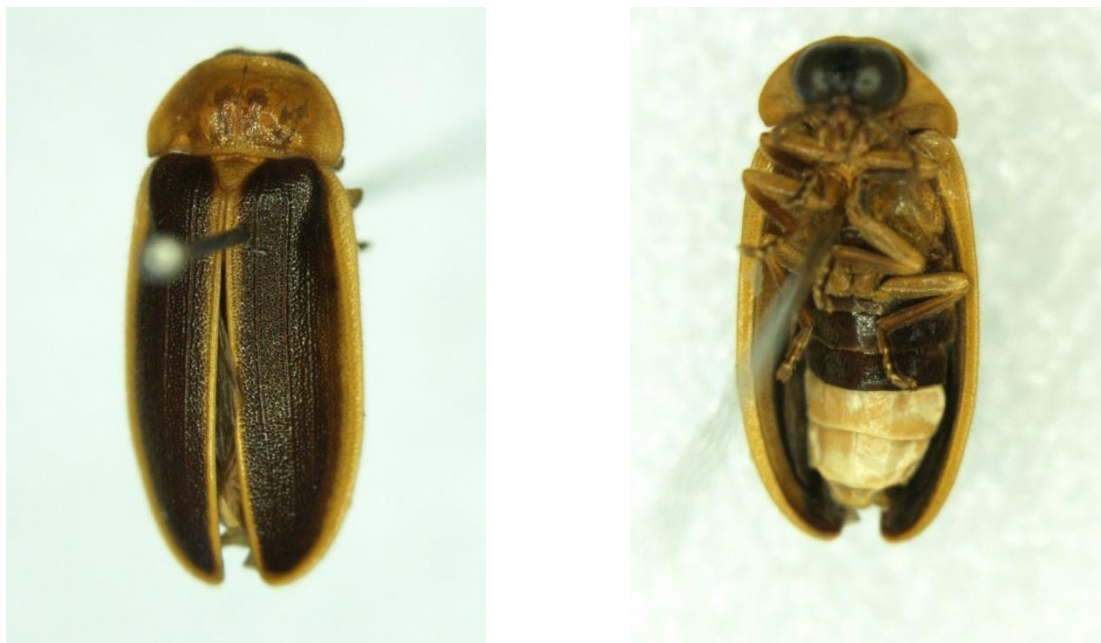
รูปที่ 1 ภาพแสดงหิ่งห้อยชนิด Asymmetricata circumdata (Motschulsky, 1854) เพศผู้ (ซ้าย: ด้านหลัง, ขวา: ด้านท้อง)