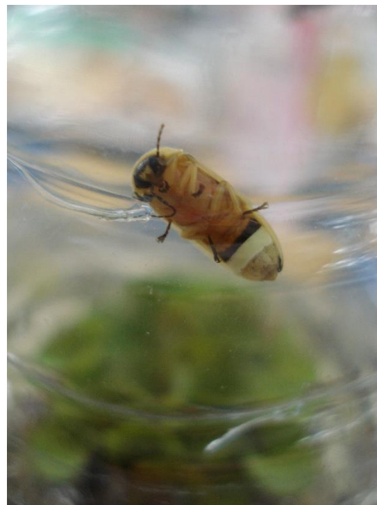
รูปที่ 2 ภาพแสดงหิ่งห้อยชนิด Asymmetricata circumdata (Motschulsky, 1854) (ซ้าย: เพศผู้, ขวา: เพศเมีย)