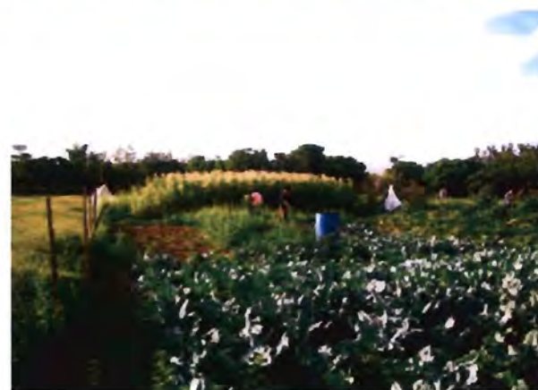
แปลงที่ 3 (LN3): มีการใช้สารเคมีกำจัดวัชพืชและปุ๋ยเคมี