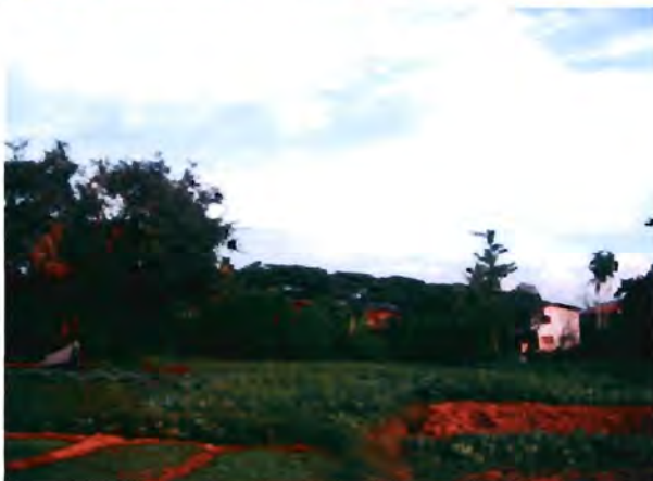
แปลงที่ 2 (LN2): มีการใช้สารเคมีกำจัดวัชพืชและปุ๋ยเคมี