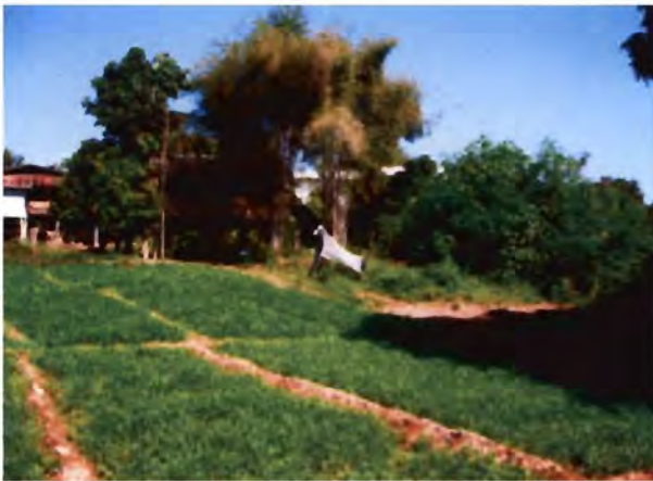
แปลงที่ 1 (LN1): มีการใช้สารเคมีกำจัดวัชพืชและปุ๋ยเคมี

เก็บตัวอย่างที่แปลงปลูกผัก 3 แปลง ที่ตำบลไหล่น่าน อำเภอเวียงสา จังหวัดน่าน