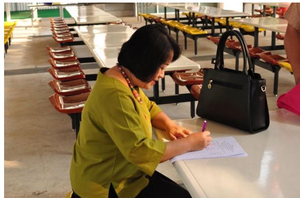
ภาพที่ 1- 1 การลงทะเบียน