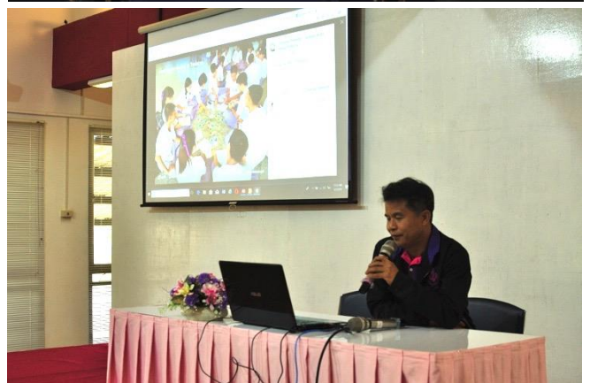
ภาพที่ 1- 2 บรรยากาศการเสวนา