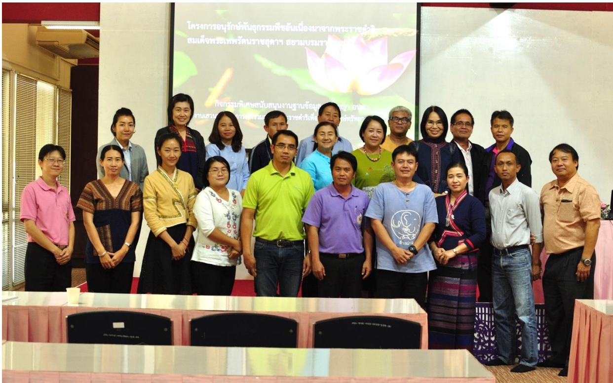
ภาพที่ 1- 4 ถ่ายรูปรวม