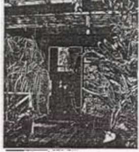
บ้านข้างโรงเรียนกับครอบครัวคนต่าง 132