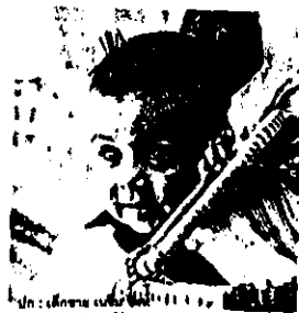
ปก : เลิศกมล นนทชัย ภาพ : นนทชัย นนทชัย