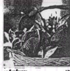
บ้านข้าวกับแม่ 138