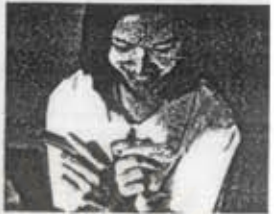
ลูกขอ... พ่อแม่ไม่ใจ 24