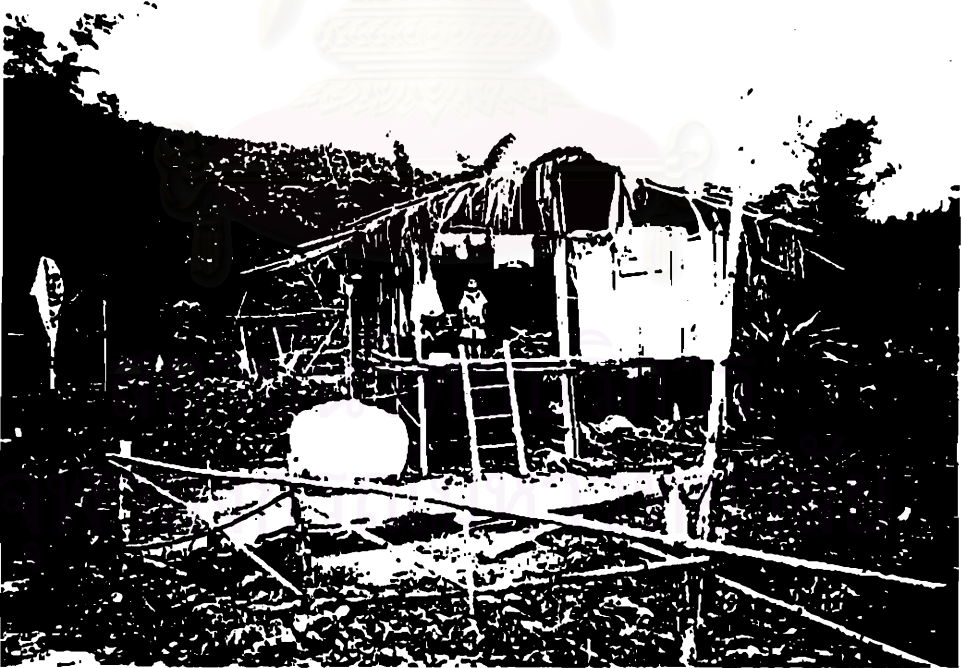
ภาพประกอบที่ 24