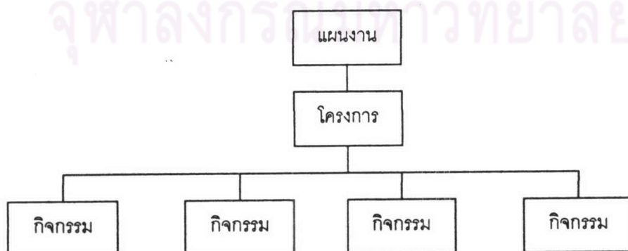
ภาพที่ 2.1 แผนภูมิ แสดงส่วนประกอบของแผนงาน

ส่วน รัตนะ บัวสนธิ์ (2540: 3-4) ได้สรุปความหมายของโครงการไว้ว่า “โครงการ” หมายถึง ส่วนย่อยหนึ่งของแผนงานซึ่งประกอบด้วย กิจกรรมทรัพยากรในการดำเนินงาน และระยะเวลาในการดำเนินงานเพื่อการบรรลุเป้าหมาย/ วัตถุประสงค์ของโครงการนั้น การให้ความหมายของโครงการเช่นนี้ทำให้วิเคราะห์ความสัมพันธ์ของสิ่งต่าง ๆ ที่ปรากฏในความหมายได้ ดังภาพที่ 2.1