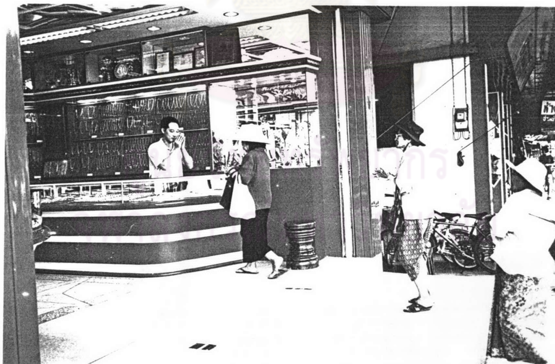
ภาพ ๑๒ แม่เพลงกำลังร้องเพลงขอทานที่ร้านทองแห่งหนึ่ง ขณะเดินทางไปร้องเพลงบอกบุญที่ตัวเมืองจังหวัดตราด เมื่อเทศกาลสงกรานต์ พ.ศ.๒๕๔๗