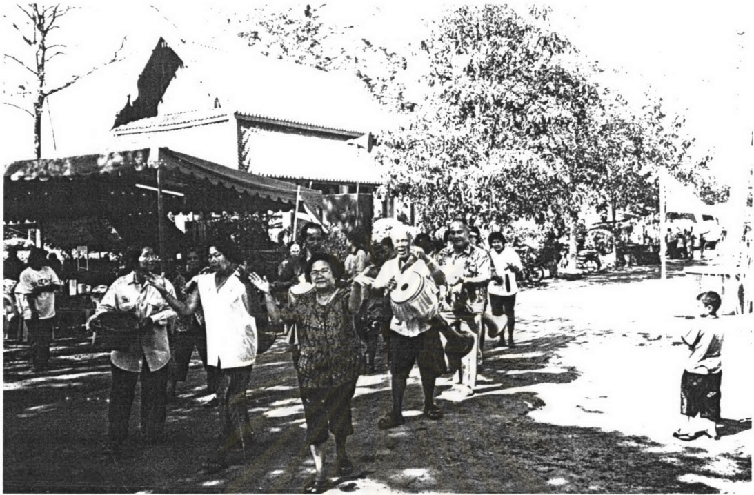
ภาพ ๒ คณะเพลงเดินบวตรข้าวสารวัดท่าโสมกำลังร่ายรำอย่างสนุกสนาน เมื่อเทศกาลสงกรานต์ พ.ศ.๒๕๔๗