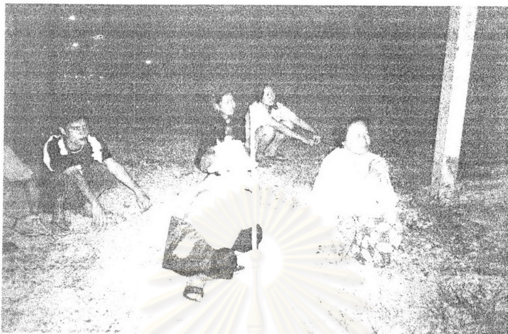
ภาพ ๓ คณะเพลงรำภาขาวสารวัดบางปรือขณะร้องเพลง เมื่อ พ.ศ. ๒๕๔๖