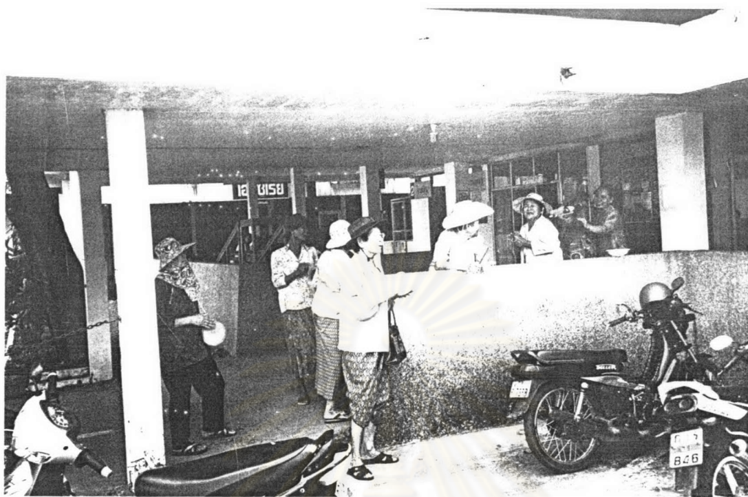
ภาพ ๑๑ ขณะเพลงขอทานวัดท่าพริก ระหว่างไปร้องเพลงบอกบุญในโรงพยาบาลตราด เมื่อเทศกาลสงกรานต์ พ.ศ.๒๕๔๗