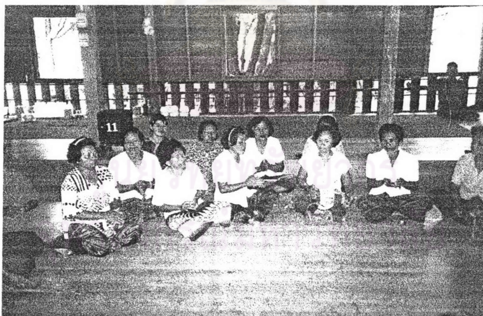
ภาพ ๒๒ ชาวบ้านทุ่งไถ่ดัก (ชาวซอง) กำลังสาธิตการร้องเพลงขอทานให้แก่ผู้วิจัย ที่วัดสุวรรณภักดี ในวันทำบุญสงกรานต์วันสุดท้าย พ.ศ. ๒๕๔๖