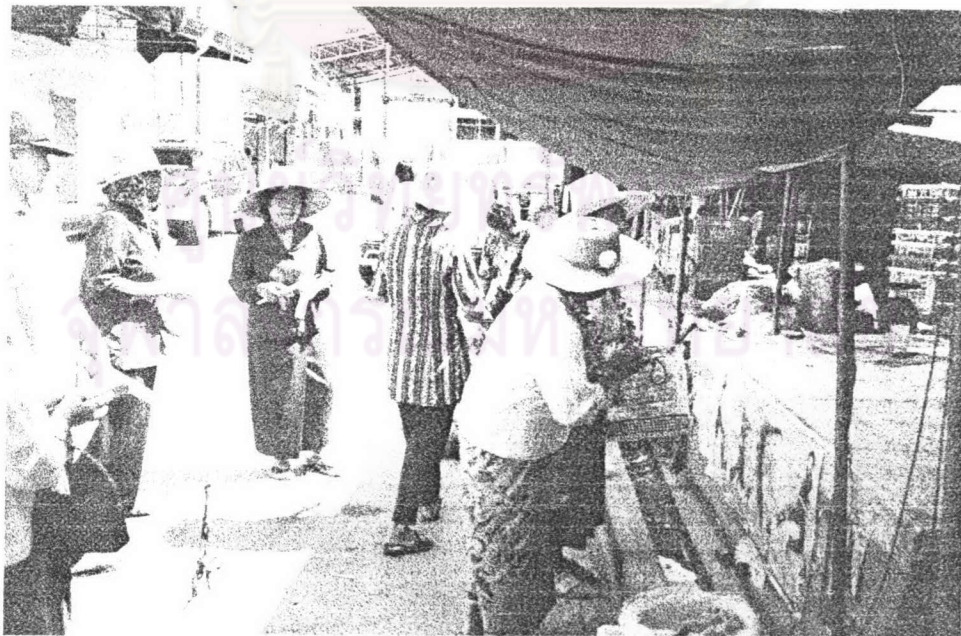
ภาพ ๒ แม่เพลงขอทานวัดท่าพริกขณะร้องเพลงขอทาน ในตลาดสดเทศบาลจังหวัดตราด เมื่อ พ.ศ. ๒๕๔๖