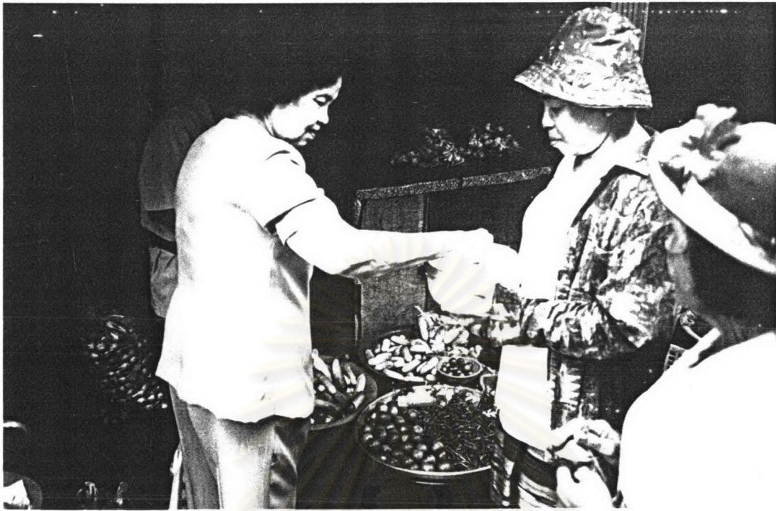
ภาพ ๑๙ ชาวบ้านกำลังทำทานกับคณะเพลงขอทานวัดสุวรรณภักดี เมื่อเทศกาลสงกรานต์ พ.ศ.๒๕๔๗