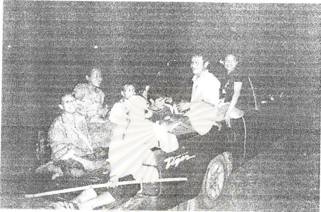
ภาพ ๑ คณะเพลงรำภาข้าวสารวัดบางปรือกำลังนั่งรถไปบอกบุญในหมู่บ้าน เมื่อ พ.ศ. ๒๕๔๖