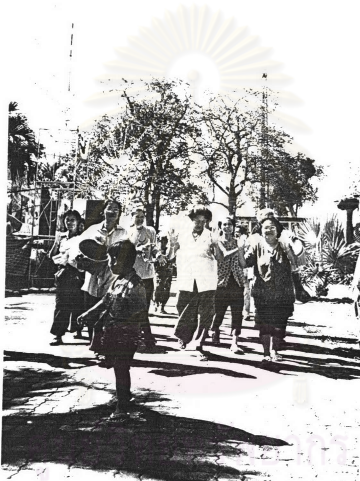
ภาพ ๑ คณะเพลงเดินบาตรข้าวสารกำลังออกเดินทางจากวัดท่าโสมเพื่อไปบอกบุญในหมู่บ้าน เมื่อเทศกาลสงกรานต์ พ.ศ.๒๕๔๗