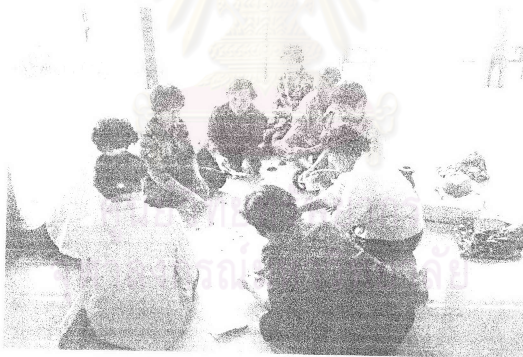
ภาพ ๖ คณะเพลงช่วยกันตรวจนับเงินที่ได้ภายหลังจากร้องเพลงขอทานเสร็จ