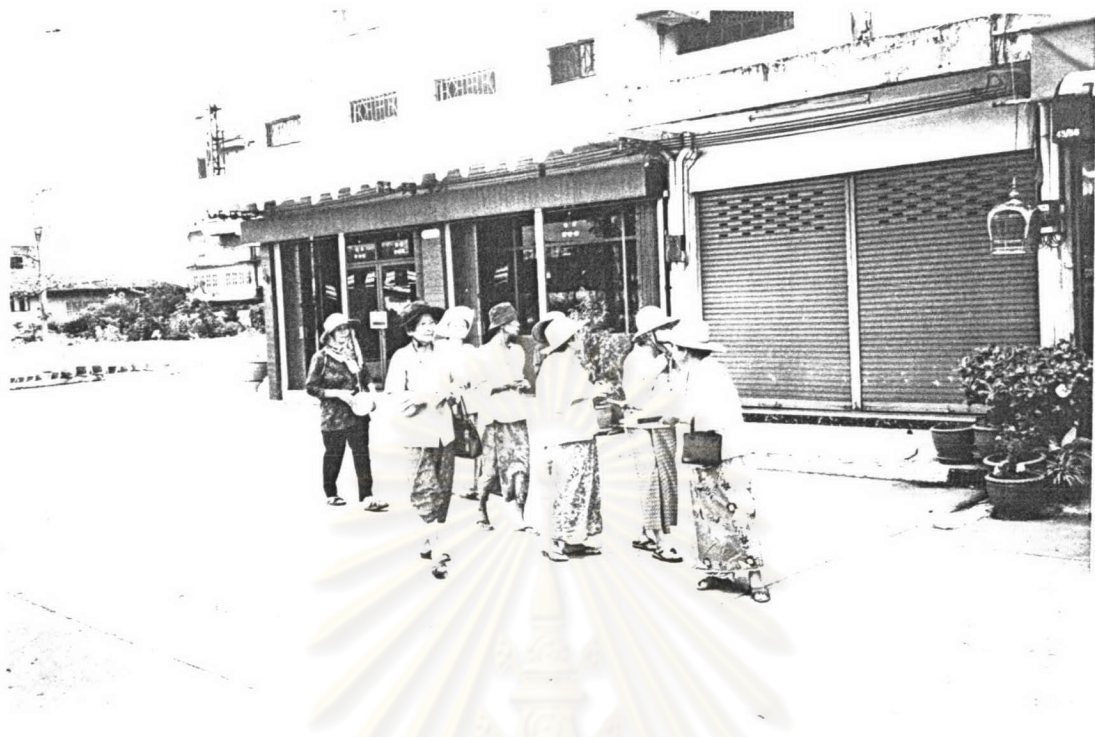
ภาพ ๙ คณะเพลงขอทานวัดท่าพริก ขณะเข้าไปร้องเพลงบอกบุญในตัวเมืองตราด เมื่อเทศกาลสงกรานต์ พ.ศ.๒๕๔๗