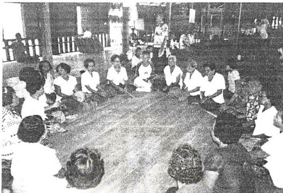
ภาพ ๒๑ ชาวบ้านทุ่งไถ่ดัก (ชาวซอง) กำลังสาธิตการร้องเพลงขอทานให้แก่ผู้วิจัย ที่วัดสุวรรณภักดี ในวันทำบุญสงกรานต์วันสุดท้าย พ.ศ. ๒๕๔๖