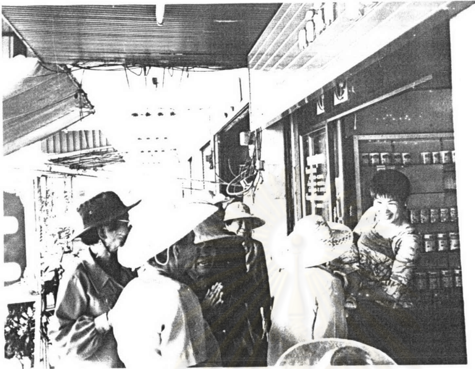
ภาพ ๑๓ ปฏิบัติการระหว่างชาวบ้านกับคณะเพลงขอทานวัดท่าพรุก เมื่อเทศกาลสงกรานต์ พ.ศ.๒๕๔๗