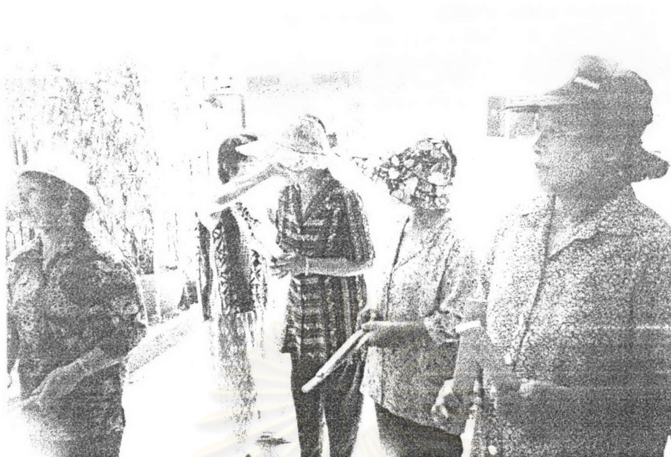
ภาพ ๓ ชาวบ้านรดน้ำสงกรานต์กับคณะเพลงขอทาน