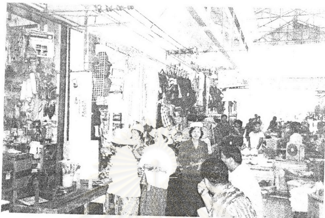
ภาพ ๕ แม่เพลงขอทานกำลังร้องเพลงขอทานเพื่อขอหมวกให้กับผู้วิจัย