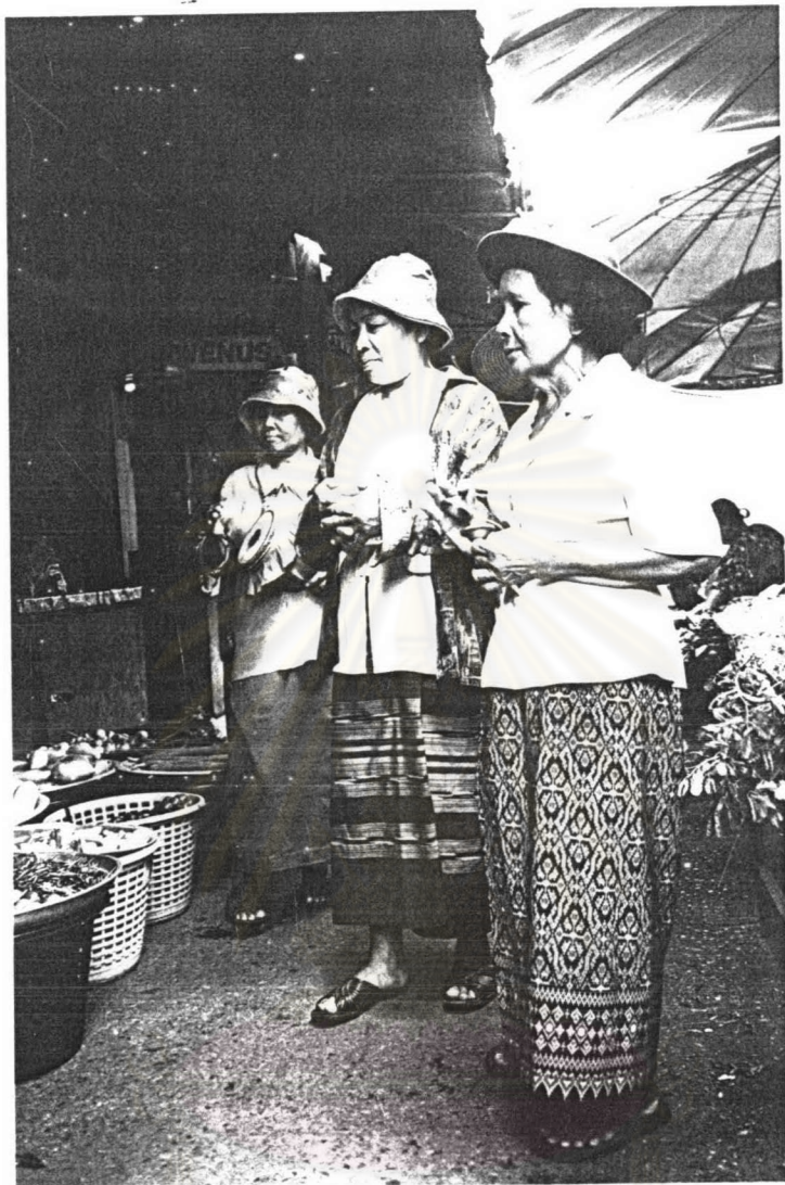
ภาพ ๑๖ แม่เพลงวัดสุวรรณภักดีกำลังร้องเพลงบอกบุญในตลาดสดเทศบาลจังหวัดตราด เมื่อเทศกาลสงกรานต์ พ.ศ.๒๕๔๗