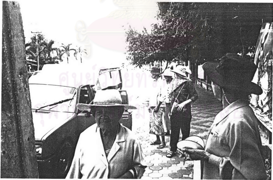
ภาพ ๘ แม่เพลงคนหนึ่งเหมารถโดยสารตามมาสวมทบคณะเพลง ขณะเดินทางไปร้องเพลงบอກบุญที่ตัวเมืองจังหวัดตราด เมื่อเทศกาลสงกรานต์ พ.ศ.๒๕๔๗