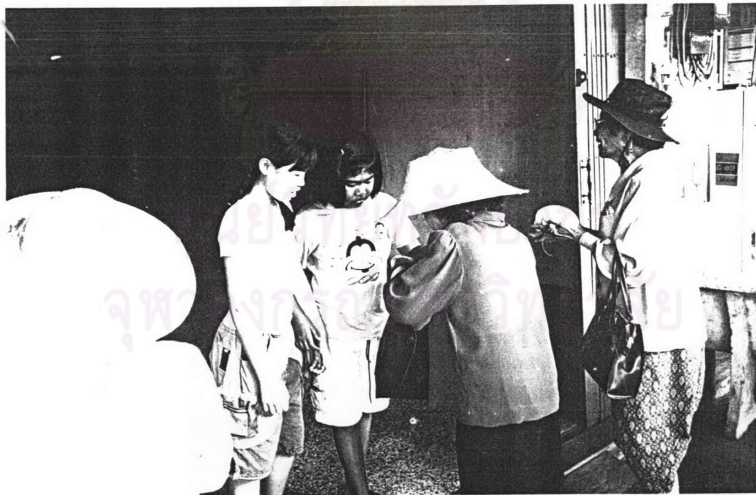
ภาพ ๑๔ ผู้ปกครองกำลังฝึกลูกหลานให้ทำบุญกับคณะเพลงขอทาน เมื่อเทศกาลสงกรานต์ พ.ศ.๒๕๔๗