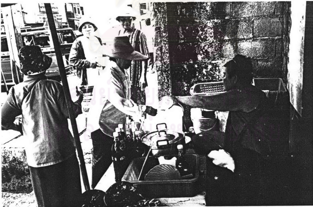
ภาพ ๒๐ ชาวบ้านเลี้ยงเครื่องต้มแก่คณะเพลงขอทานวัดสุวรรณภักดี เมื่อเทศกาลสงกรานต์ พ.ศ.๒๕๔๗