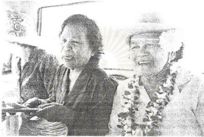
ภาพ ๑ แม่เพลงขอทานวัดท่าพริกขณะเดินทางไปร้องเพลงขอทาน ในตัวเมืองจังหวัดตราด เมื่อ พ.ศ. ๒๕๔๖