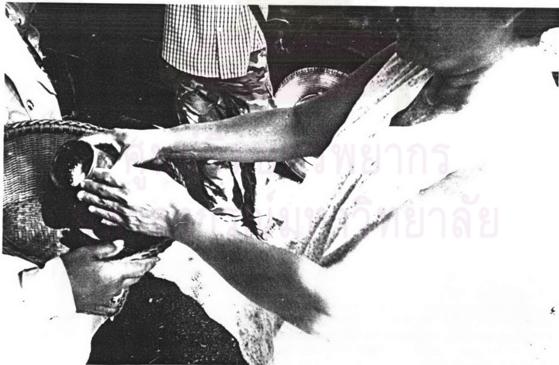
ภาพ ๓ ชาวบ้านกำลังทำทานกับคณะเพลงด้วยข้าวสาร เมื่อเทศกาลสงกรานต์ พ.ศ.๒๕๔๗