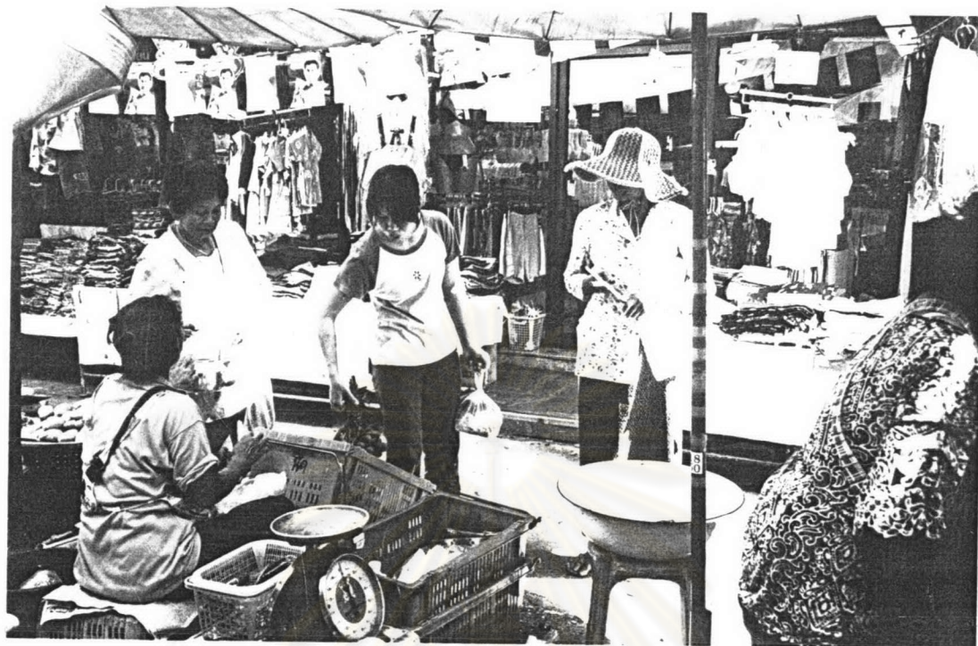
ภาพ ๑๗ แม่เพลงวัดสุวรรณภักดีกำลังแสดงหนังสือชี้แจงจากเจ้าอาวาสให้ชาวบ้านดู เมื่อเทศกาลสงกรานต์ พ.ศ.๒๕๔๗