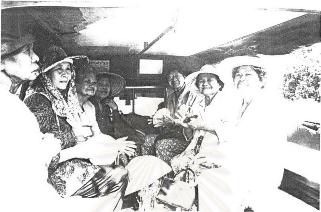
ภาพ ๗ คณะเพลงขอทานวัดท่าพรึก ขณะเดินทางไปร้องเพลงบอກบุญ เมื่อเทศกาลสงกรานต์ พ.ศ.๒๕๔๗