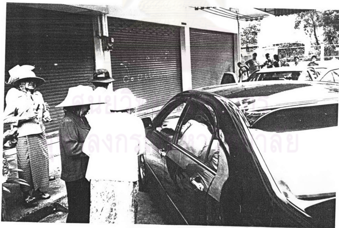
ภาพ ๑๐ แม่เพลงกำลังร้องเพลงขอทานเพื่อเรียโรคนที่นั่งอยู่ในรถ เมื่อเทศกาลสงกรานต์ พ.ศ.๒๕๔๗