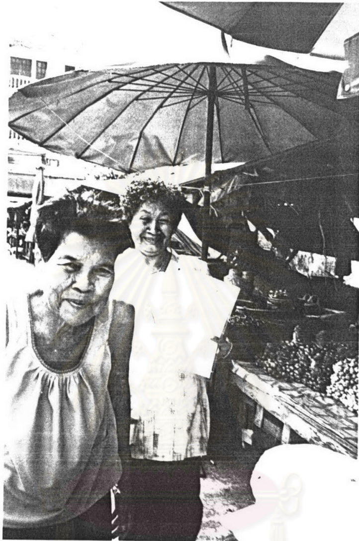
ภาพ ๑๕ แม่เพลงวัดสุวรรณภักดีกำลังแสดงหนังสือชี้แจงเรื่องการบอกบุญของวัด จากเจ้าอาวาสวัด ขณะเดินทางไปร้องเพลงบอกบุญ เมื่อเทศกาลสงกรานต์ พ.ศ.๒๕๔๗