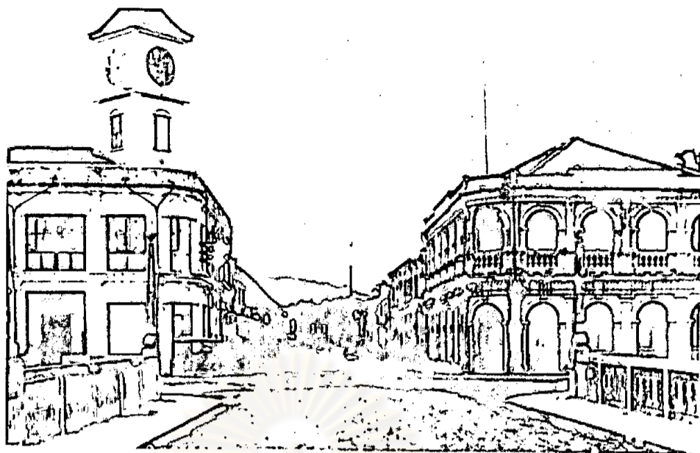
ตึกแถวหน้ากุ๊กก๊ก