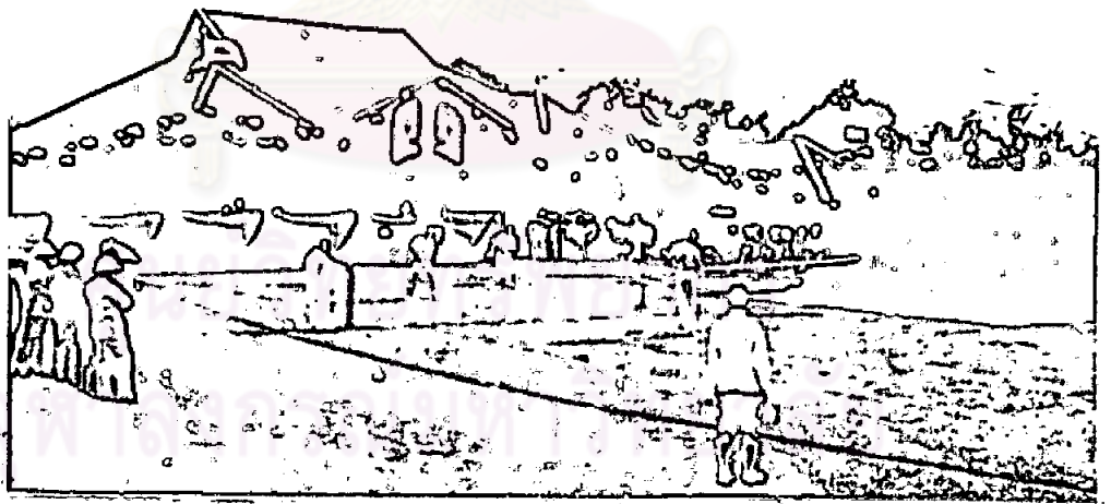
สีโพลีโธมอยู่หน้าวัดดงลิ้น