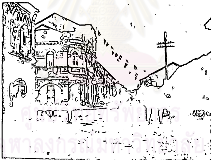
ถนนสายหลังหน้ากุ๊กก๊ก