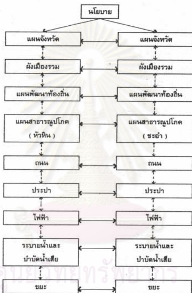
แผนภูมิที่ 6.5 แสดงการประสานการพัฒนาทางแนวนอน