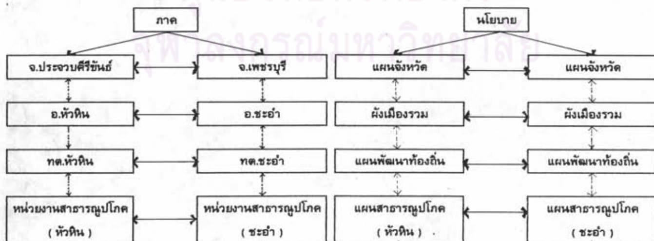
แผนภูมิที่ 6.4 แสดงความสัมพันธ์ของการวางแผนในแนวนอน

จากแผนภูมิที่ 6.4 แสดงให้เห็นถึงบทบาทความเชื่อมโยงของแผนพัฒนาในแนวนอนที่ให้ความสำคัญของพื้นที่แหล่งท่องเที่ยวทั้งสอง ในการกำหนดแผนที่ใช้ชี้นำการปฏิบัติ โดยให้มีความสัมพันธ์อยู่ในกรอบของการประสานสอดคล้องกับหน่วยงานในพื้นที่แหล่งท่องเที่ยวทั้งสอง ที่ถูกจำกัดด้วยเส้นแบ่งเขตการปกครอง ให้มีการพัฒนาพื้นที่ที่ประสานสอดคล้องกันทั้งในด้านการประสานแผนและความสัมพันธ์ขององค์กรหรือหน่วยที่ปฏิบัติ เพื่อให้เกิดการพัฒนาได้อย่างเหมาะสม