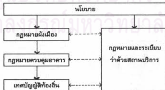
แผนภูมิที่ 6.3 แสดงแนวทางการกำหนดมาตรการควบคุมการพัฒนาในแนวตั้งหรือแนวดิ่ง

การกำหนดมาตรการควบคุมการพัฒนาในแหล่งท่องเที่ยวหัวหิน-ชะอำ หน่วยงานภาครัฐควรริบเร่งดำเนินการประสานงานกันระหว่างหน่วยงานที่เกี่ยวข้องเพื่อหาแนวทางในการปรับปรุงแก้ไขความซ้ำซ้อนของมาตรการต่าง ๆ และการขาดความสอดคล้องกันระหว่างมาตรการ รวมทั้งขาดความสอดคล้องกับนโยบายพัฒนาของแผนหลักฯ ซึ่งหน่วยงานภาครัฐที่กำหนดมาตรการต่างๆ เหล่านี้ ควรเร่งดำเนินการปรับปรุงแก้ไขมาตรการควบคุม ให้อยู่ภายใต้กรอบนโยบายเดียวกัน และกำหนดเป็นมาตรการที่ชัดเจน โดยคำนึงถึงขอบข่ายความเชื่อมโยง และระดับความสำคัญของมาตรการต่าง ๆ จากมาตรการระดับภาคส่งผ่านสู่มาตรการระดับท้องถิ่น ในแนวทางการควบคุมที่จะชี้้นำให้เกิดการพัฒนาที่ประสานสอดคล้องกัน และเกิดความสอดคล้องกับนโยบายของแผนหลักฯ โดยหน่วยงานภาครัฐที่กำหนดมาตรการไว้ ควรปรับปรุงแก้ไขมาตรการต่าง ๆ ที่ใช้บังคับในพื้นที่แหล่งท่องเที่ยวในแนวทางเดียวกัน ดังแสดงในตารางที่ 6.3