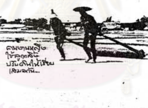
คนงานที่ ใช้ลูกสูบ ปรับดินให้ เรียบก่อน เริ่มงาน...

“บางคนยังเข้าใจว่าเกลือที่ผลิตขึ้นมาใช้บริโภคอย่างเดียว ความจริงไม่ใช่ เกลื่อนำไปใช้สอยประโยชน์ในโรงงานอุตสาหกรรม หลายอย่างทั้งโรงงานน้ำแข็ง ออกรเหล็ก ใส่ออกุ๊ปปลา อ่านต่อหน้า 1