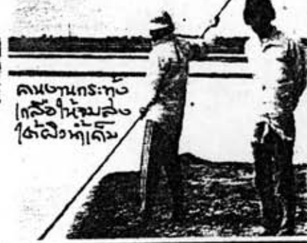
คนงานที่ เกลือให้ ใช้ลูกสูบ ปรับดินให้ เรียบก่อน เริ่มงาน...

ราคาในช่วงที่ถูกลงมากจะตก บาท และถ้าราคาสูงสุดก็ในราวถึง บาท” นางมนต์ยังชี้แจงคุณสมบัติ ของนาเกลือว่า นำเกลือที่ไหลจากกองเกลือ สามารถขายให้แก่โรงงานทำเตาหัวหลอด