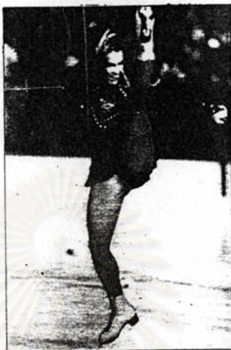
สาวแก๊ง 1 - อีดาของ แคนทริน่า วิคต์ สาวจากเยอรมนี ตะวันออกที่ได้รับความนิยมให้เป็นที่พิศวงขององค์การยูนิเซฟ