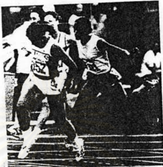
ราชันกรีฑาเอเชีย : ลีเคียว เตอเวทัก นักวิ่งสาวสวย ชาวฟิลิปปินส์ พุ่งเข้าเส้นชัยเป็นคนแรกในการวิ่ง 100 เมตร โดยทำเวลาได้ 11.43 วินาที ตามด้วย พี.ที.อุษา จากอินเดีย ในกรีฑาเอเชียที่สิงคโปร์

สยามรัฐ 26 กรกฎาคม 2530 หน้า 16 ประเด็น สตรีกับกีฬา