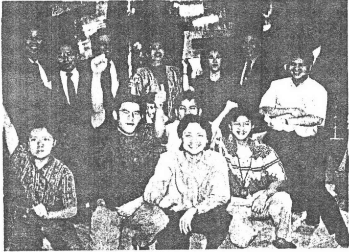
△..กันที่ทีมงาน ทีวี วาที 9 ใหม่

"มีอะไรคล้าย ๆ กับรายการทีวี วาที ให้เด็กลองพูด ลองเล่น โดยสมาชิกในบริษัทเป็นคนเขียนบทเอง กำกับเอง มีกิจกรรมเด็ก ๆ เอง แรก ๆ ได้รับความร่วมมือจาก สโมสรมีน้อย ส่งสมาชิกเข้าร่วม ต่อมาเด็ก ๆ ของเราทั้งชั้น และมีผู้ชมทางบ้าน