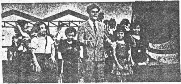
△..รายการ ซุเปอร์จิว

กัษวี ภู่วิวัฒนกุล..เรื่อง