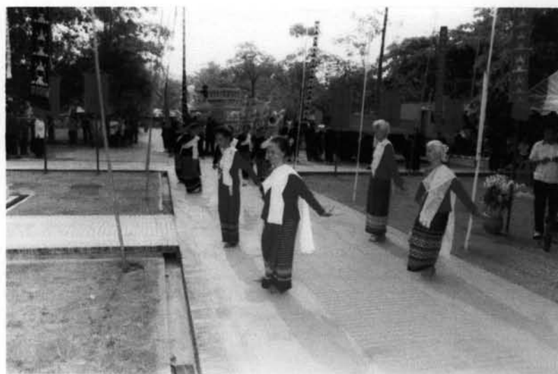
ภาพที่ 3.3 : คณะช่างฟ้อนเล็บอาวโสวัดพระสิงห์ฟ้อนเล็บบวงสรวง การอัญเชิญ พระ พุทธสิงค์ หรือพระสิงห์ ออกทรงน้ำในประเพณีสงกรานต์ ถ่ายเมื่อวันที่ 13 เมษายน ปีพ.ศ. 2548