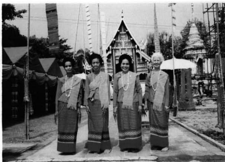
ภาพที่ 3.5 : คณะช่างฟ้อนอาวโสวัดพระสิงห์ ถ่ายภาพหลังจากฟ้อนเล็บ บวงสรวงการอัญเชิญพระพุทธสิหิงค์ หรือ พระสิงห์ ออกทรงน้ำ ถ่ายบริเวณหน้าวิหารลายคำ เมื่อวันที่ 12 เมษายน ปีพ.ศ. 2546