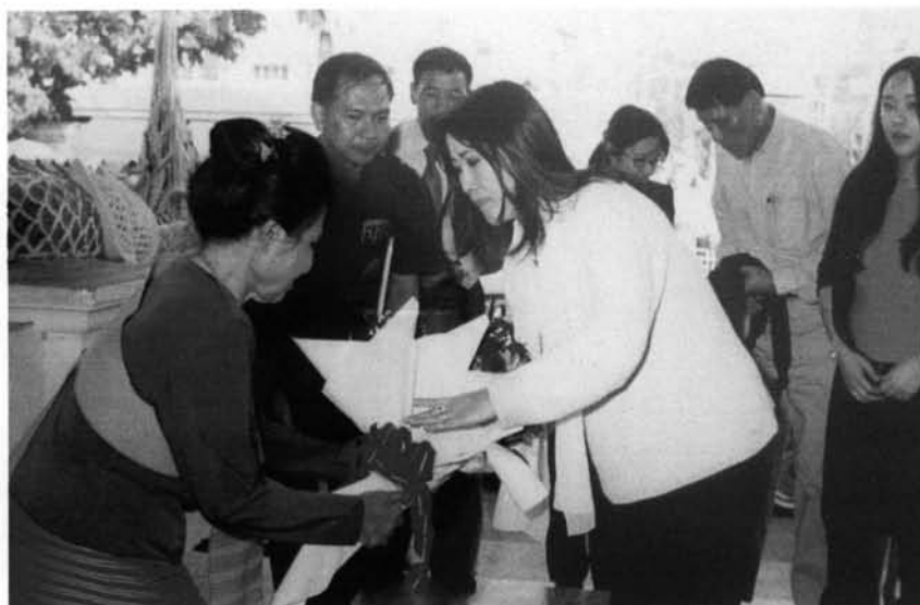
ภาพที่ 3.8 : ทูลเกล้าถวายช่อดอกไม้แด่พระราชินีแห่งประเทศภูฐานในการเสด็จ เยี่ยมชมวัดพระสิงห์วรมหาวิหาร จังหวัดเชียงใหม่ เมื่อวันที่ 26 มีนาคม 2546