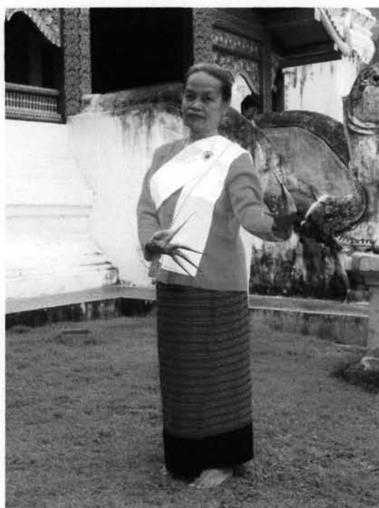
ภาพที่ 3.18 : รูปแบบการนุ่งซิ่นของคณะช่างฟ้อนเล็บอาวุโสวัดพระสิงห์

ผ้าซิ่นที่ใช้สำหรับสวมใส่ในการฟ้อนเล็บ คณะช่างฟ้อนจะทำการปรึกษากันในกลุ่มว่า ในการจัดซื้อผ้าซิ่นจะต้องการแบบใด สีอะไร และเนื้อผ้าที่ใช้ในการทอ เวลาสวมใส่จะสบายไม่ลำบาก การดูแลรักษาเนื้อผ้าทำอย่างไร เมื่อมีการตกลงในตลาดและองค์ประกอบของผ้าซิ่นก็จะทำการจัดซื้อที่แหล่งขายผ้า โดยส่วนใหญ่จะหาซื้อจากภาคหลวง ผ้าซิ่นส่วนใหญ่ที่คณะช่างฟ้อนได้ซื้อมาจะเป็นผ้าซิ่นลายขวางต่อแอมและเชิงสี่คำ ในบางครั้งเมื่อมีงานใหญ่ระดับจังหวัดอาจจะสวมใส่ผ้าซิ่นที่มีการต่อเชิงจก เนื้อผ้าซิ่นที่ทางคณะช่างฟ้อนจัดซื้อเพื่อสวมใส่ส่วนใหญ่จะเป็นผ้าซิ่นที่ทอด้วยด้ายโทเร โดยจะทอกันเป็นโรงงาน หรืออาจจะเป็นกลุ่มชาวบ้าน เพราะผ้าประเภทนี้มีคุณสมบัติง่ายต่อการดูแลรักษา สำหรับผ้าซิ่นที่เป็นผ้าฝ้ายคณะช่างฟ้อนจะไม่นิยมนำมาสวมใส่ เพราะการดูแลรักษายาก ลักษณะสวลลายของตัวซิ่น จะเป็นซิ่นตาแล้ว ต่อเชิงสี่คำ เมื่อได้ผ้าซิ่นก็จะทำการตัดเย็บเป็นผ้าถุงสำเร็จ เพื่อง่ายต่อการสวมใส่