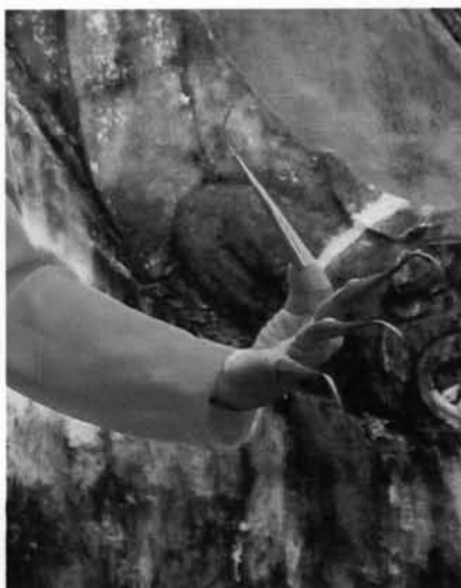
ภาพที่ 3.22 : รูปเล็บฟ่อนของคณะช่างฟ่อนอาวุโสวัดพระสิงห์ ที่มา : ผู้วิจัย ถ่ายเมื่อ

เล็บฟ่อนของคณะช่างฟ่อนอาวุโสวัดพระสิงห์ จะนิยมใช้เล็บฟ่อนที่ทำขึ้นจากแผ่นทองเหลือง โดยจะสวมทั้ง 8 นิ้ว ยกเว้นนิ้วหัวแม่มือทั้งสองข้าง การที่ช่างฟ่อนเล็บวัดพระสิงห์นิยมใช้เล็บสีทองเพราะด้วยสาเหตุที่ว่า มีความสวยงามเหมือนทองคำ เหมาะสมกับสังฆาลและเข็มกลัด แต่มีช่างฟ่อนบางคณะจะนิยมใช้เล็บฟ่อนที่มีสีเงิน โดยทางคณะช่างฟ่อนเล็บอาวุโสวัดพระสิงห์ จะจัดซื้อจากแหล่งที่มีเล็บฟ่อนจำหน่าย และบางครั้งก็ได้รับการเชิญให้ไปฟ่อนทางคณะเจ้าภาพ จะมีการจัดเตรียมเล็บฟ่อนไว้ให้สวมใส่เวลาฟ่อน เพื่อความสวยงามของตัวเล็บ และเมื่อฟ่อนเสร็จก็จะนิยมให้ไว้เป็นที่ระลึกหรือเป็นสินน้ำใจที่มาร่วมฟ่อนในงาน