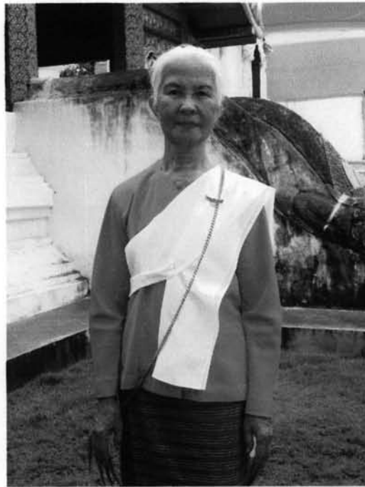
ภาพที่ 3.19 : รูปแบบเสื้อและการห่มสไบของคณะช่างพ็อนเล็บอาวโสวัดพระสิงห์

เสื้อที่ใช้สวมใส่ในการพ็อนของคณะช่างพ็อนเล็บอาวโสวัดพระสิงห์ โดยส่วนใหญ่จะสวมเสื้อแขนกระบอกคอกลมผ่าอก ตัดเย็บแบบทรงพื้นเมืองเข้ารูป สีที่ใช้จะนิยมใช้สีที่เหมาะสมกับสีขอผ้าซิ่น ในบางครั้งอาจจะใช้เสื้อสีเดียวกับสีผ้าซิ่น หรืออาจจะใช้สีสลับกัน เนื้อผ้าจะเลือกผ้าที่มีคุณลักษณะถ่ายเทอากาศได้ดี สามารถสวมใส่ได้ทุกโอกาส เนื้อผ้าไม่แข็งหรือนุ่มจนเกินไป สีส่วนใหญ่ที่ทางคณะช่างพ็อนอาวโสมีจะนิยมสีเขียว เพราะดูแล้วสบายตาและเหมาะสมกับวัยของผู้สวมใส่