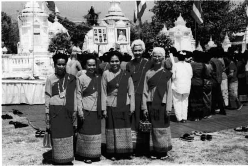
ภาพที่ 3.6 : คณะช่างฟ้อนอาวุโสวัดพระสิงห์ ถ่ายรูปบริเวณด้านหน้ากุ้งเจ้านาย ฝ่ายเหนือหลังจากการฟ้อนถวาย ในพิธีคำหัวกุ้งเจ้านายฝ่ายเหนือ ถ่ายเมื่อวันที่ 19 เมษายน ปี พ.ศ. 2545