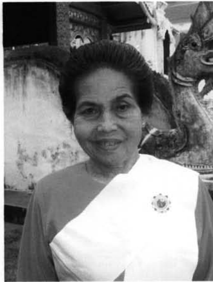
ภาพที่ 3.20 : การเกล้าผมด้านหน้าของช่าง พ็อนเล็บอาวโสวัดพระสิงห์ ด้านหน้า

และด้านหลังเสร็จ ส่วนปลายผมที่เหลือก็จะทำการขมวดเป็นมวยบริเวณกลางศีรษะ และเหน็บดอกไม้ ส่วนการเกล้าผมในแบบที่ 2 จะเป็นการเกล้าผมแบบรวบคิ๊งเป็นมวยไว้บริเวณท้ายทอย และเหน็บดอกไม้ การเกล้าผมในแบบที่สอง จะเป็นการเกล้าที่ช่างพ็อนเกล้าเองมาที่บ้าน ถ้าต้องไปพ็อนเล็บแล้วช่างพ็อน ไม่มีเวลาที่จะไปเกล้าผมที่ร้านประกายแก้ว ช่างพ็อนก็จะเกล้ากันเอง โดยจะใช้ทรงผมที่สามารถเกล้ากันเองได้