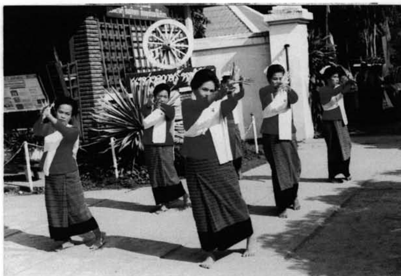
ภาพที่ 3.4 : คณะช่างฟ้อนอาวโสวัดพระสิงห์ฟ้อนเล็บนำขบวนแห่คร้วทาน บริเวณทางเข้าวัด ถ่ายเมื่อประมาณ ปี 2537 ที่มา : นางจันทร์จร ศศิธร