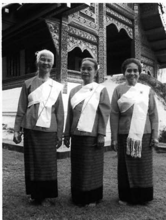
ภาพที่ 3.17 : รูปแบบการแต่งกายของคณะช่างฟ้อนเล็บอาวโสวัดพระสิงห์

การแต่งกายของช่างฟ้อนเล็บได้สันนิษฐานว่าในสมัยโบราณ คงจะไม่ได้วางระเบียบแบบแผนการแต่งกายของช่างฟ้อนเล็บเอาไว้ ช่างฟ้อนนำขบวนแห่ครัวทานหรือช่างฟ้อนหัววัดอาจจะแต่งกายตามแบบชีวิตประจำวันของชาวบ้านแต่ละท้องถิ่นเป็นหลัก แต่คงจะประดิษฐ์ดัดแปลงให้มีความสวยงามมีสีสันยิ่งขึ้นจากของเดิม กล่าวคือ นุ่งซิ่น สวมเสื้อแขนกระบอก ห่มสไบ มีเครื่องประดับ นิยมเกล้ามวยผมตามแบบอย่างประเพณีของล้านนา และนิยมประดับดอกไม้เป็นส่วนใหญ่ แต่อาจจะใช้ดอกไม้ตามฤดูกาลแล้วแต่ภูมิภาค