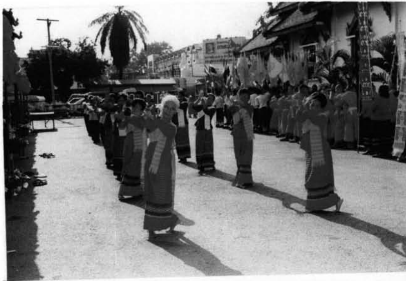
ภาพที่ 3.7 : คณะช่างฟ้อนเล็บอาวุโสวัดพระสิงห์ฟ้อนเล็บรับขบวนแห่ พระพุทธสิหิงค์หรือพระสิงห์เข้าวัด ถ่ายเมื่อวันที่ 13 เมษายน ปี พ.ศ. 2546