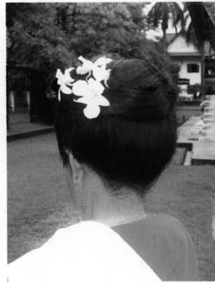
ภาพที่ 3.21 : การเกล้าผมด้านหลังของช่าง พ็อนเล็บอาวโสวัดพระสิงห์ด้านหลัง ที่มา : ผู้วิจัย