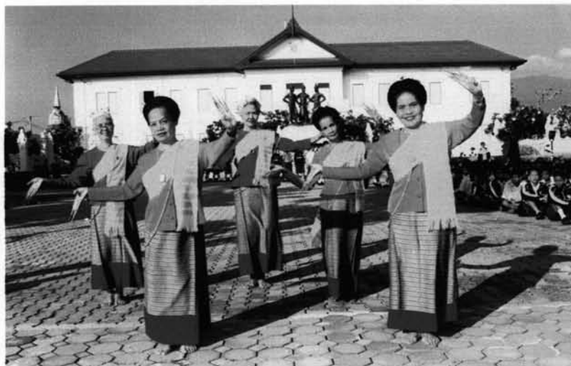
ภาพที่ 3.2 : คณะช่างฟ้อนเล็บอาวโสวัดพระสิงห์ทำการตั้งท่าถ่ายรูปบริเวณลานด้านหน้าอนุสาวรีย์ สามกษัตริย์ ในประเพณีปีใหม่ ถ่ายเมื่อ วันที่ 13 เมษายน ปีพ.ศ. 2545