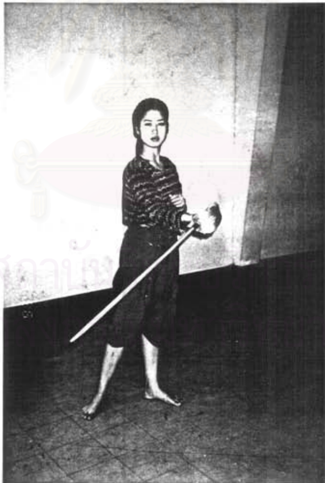
ภาพแสดงการฟันด้วยกระบี่โดยทั่วไป ในลักษณะฟันต่ำ

1. ท่าฟันด้วยกระบี่ ผู้แสดงจะถือกระบี่ด้วยวิธีที่ 1 หรือ 2 ก็ได้ หงายมือในระดับเอว หักข้อมือขึ้น ลักษณะของกระบี่จะอยู่แนวเฉียง ใช้ในการต่อสู้จริง นายธงไชย โพธิ์ยามย์ กล่าวว่า ไม่มีที่ใช้ในละครโดยเฉพาะเรื่องอิเหนา