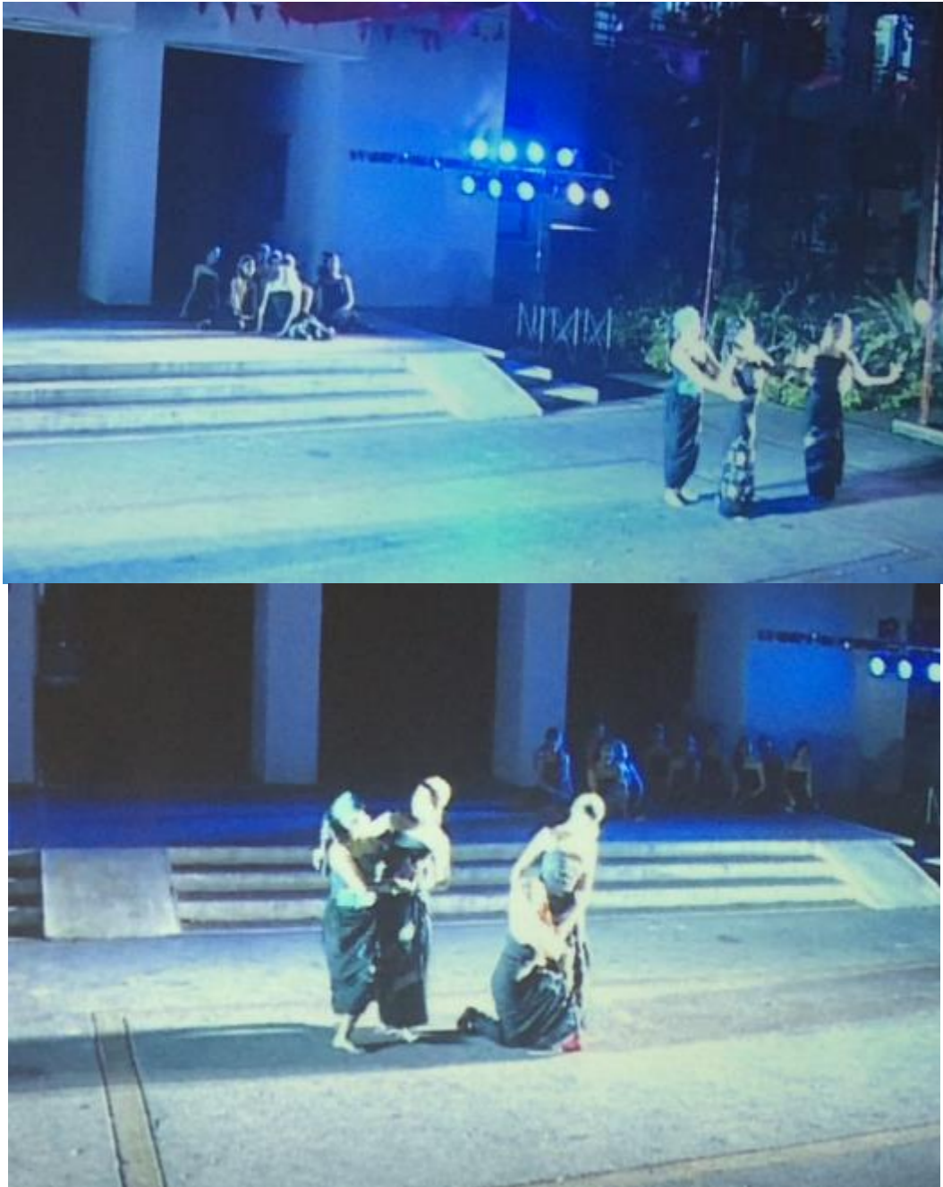
ภาพที่ 12 ความสนิทของเจ้าหญิงและพระพี่เลี้ยง

ในฉาก นางรีนนางโรยรับอาสาและพี่เลี้ยงแต่งคนสรรเสริญโฉมพระเพื่อนพระแพง มีการให้แสดงคู่อย่างใกล้ชิดระหว่างพี่เลี้ยงและเจ้านาย เพื่อแสดงความใกล้ชิดและไว้วางใจกันเป็นอย่างมาก ด้วยการให้เจ้านายอยู่ข้างหน้า อันเป็นการใช้การจัดองค์ประกอบด้านระดับของเจ้านายและผู้ใต้บังคับบัญชา