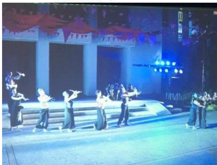
ภาพที่ 4 ฟ้อนเล็บสัญลักษณ์แห่งวัฒนธรรมภาคเหนือ

หุ่นสายจากพม่า ได้ใช้เป็นสัญลักษณ์ของบุคคลที่สาม ซึ่งขณะนั้นเนื้อเรื่องกำลังเล่าถึง เช่น ใช้หุ่นเป็นตัวแทนของพระลอผู้เลอโฉม หรือ เป็นตัวแทนของปู่เจ้าผู้เป็นเทวดาที่พระเพื่อนพระแพง เคารพนับถือ