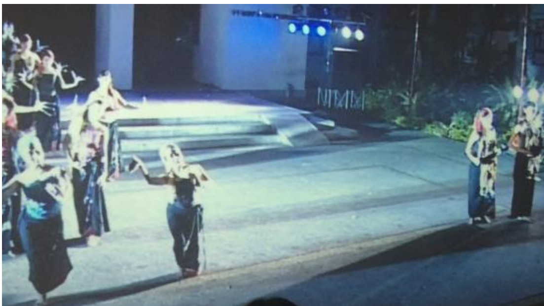
ภาพที่ 13 พี่เลี้ยงแต่งคนสรรเสริญโฉมพระเพื่อนพระแพง

จากภาพและคำสัมภาษณ์ผู้สร้างสรรค์ได้ปรากฏการใช้ทฤษฎีของ ศิลปะยุคโพสโมเดิร์นด้านซ์ เนื่องจากใช้ท่ารำไทยและเพลงพื้นบ้านของภาคเหนือ และการจัดองค์ประกอบศิลป์ เห็นได้ชัดจากการจัดตำแหน่งของเจ้าหญิงและพี่เลี้ยง อีกทั้งมีหมูนางก้านั่งนั่งดูอยู่อีกระดับหนึ่ง เป็นการสื่อให้เห็นว่าพระพี่เลี้ยงมีความใกล้ชิดกับเจ้าหญิงเป็นอย่างมาก เพราะนางก้านั่งอีกกลุ่มหนึ่งจะต้องนั่งอยู่ไกลออกไปอีกมิติหนึ่งไม่สามารถเข้าใกล้เจ้าหญิงเท่ากับพระพี่เลี้ยง