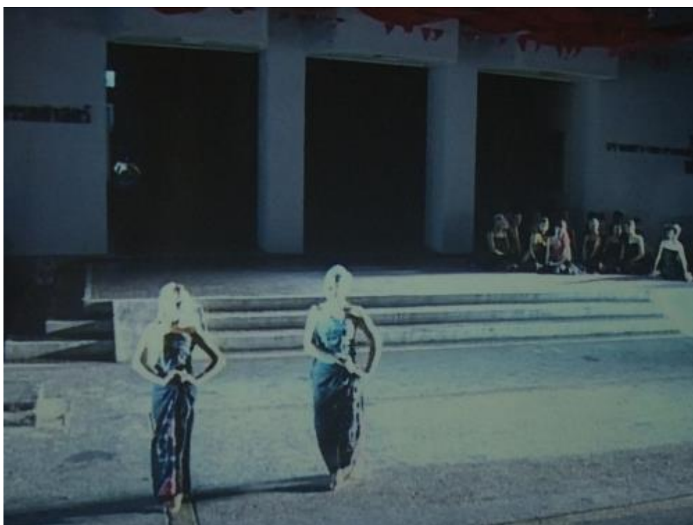
ภาพที่ 17 พระเพื่อนพระแพงกลัวมนต์ไม่ได้ผล

จากภาพและคำสัมภาษณ์ผู้สร้างสรรค์ได้ปรากฏการใช้ทฤษฎี ศิลปะยุคหลังสมัยใหม่ ซึ่งการใช้หุ่นสายพม่า เป็นการผสมผสานอุปกรณ์ที่อยู่นอกกรอบของประเพณีภาคเหนือ หรือไม่ได้มีความเกี่ยวข้องกับเนื้อเรื่องการแสดง แต่นำหุ่นสายนี้มาใช้มาใช้เพื่อเป็นสัญลักษณ์ของปู่เจ้าเท่านั้น