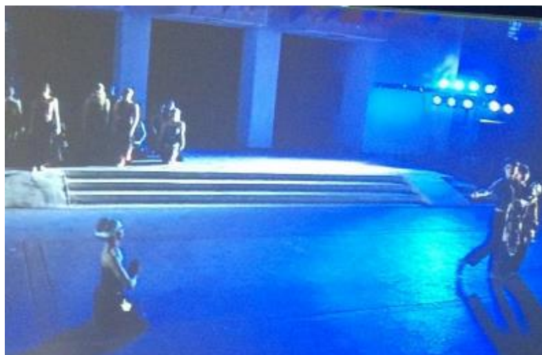
ภาพที่ 3 หุ่นสายพม่าสัญลักษณ์แห่งการเล่าถึง