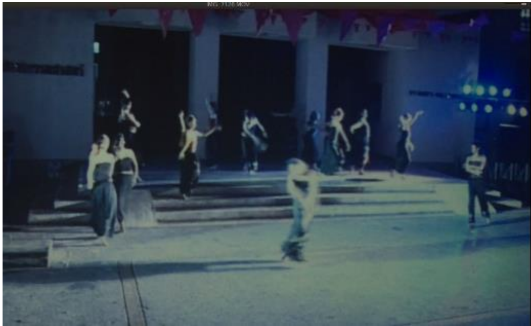
ภาพที่ 19 ปู่เจ้าแต่งทัพผี