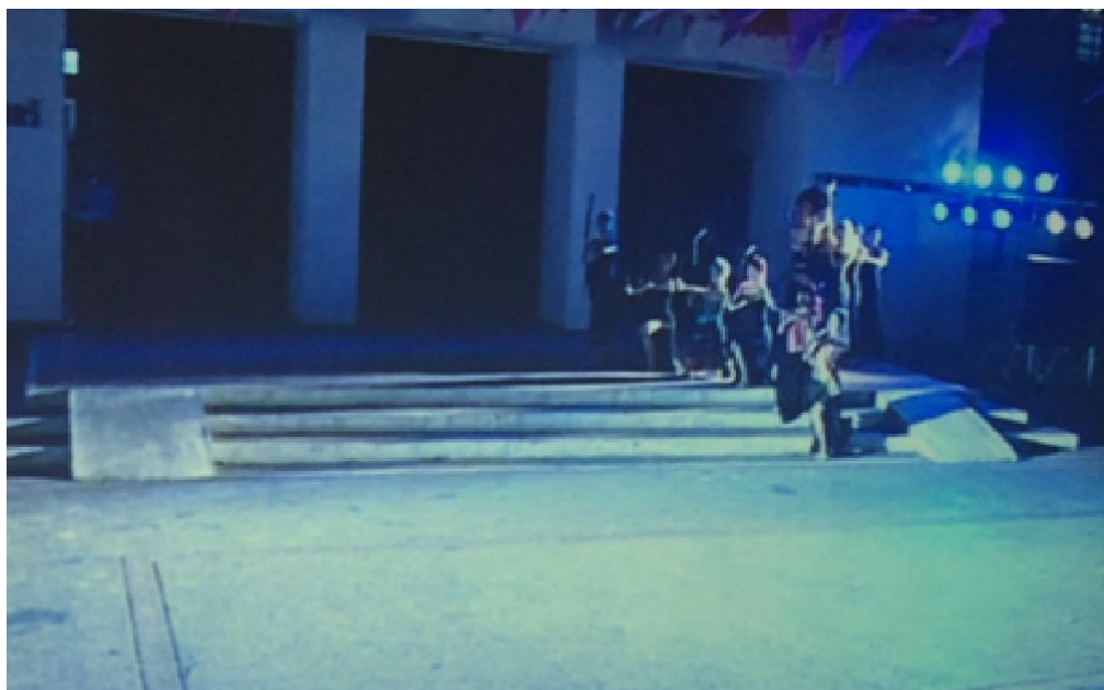
ภาพที่ 11 ท้าวแมนสรวงยกทัพไปรบเมืองสรอง ใช้ธนูเป็นสัญลักษณ์และแบบแถวหลากหลาย

ในภาพที่ 8-10 เป็นการเล่าถึงเมืองสรอง ในบทท้าวแมนสรวงยกทัพไปรบเมืองสรอง นักแสดงค่อยๆ ออกมาหลอมกันเป็นกลุ่มต่อจากฉากที่แล้ว นักแสดงทำท่าขัดฉากอย่างทหาร เป็นการยกแขนขวาวางทาบกับแขนซ้ายระดับอกขนานกับพื้น อันเป็นท่าที่ทหารใช้ฝึกวินัยก่อนรับประทานอาหาร ท่าขัดฉากนี้จึงสื่อถึงการแต่งทัพหรือการเตรียมกองทัพทหารของท้าวแมนสรวงเพื่อไปรบกับเมืองสรองแสดงถึงความเข้มแข็งของกองทัพ โดยยังใช้หุ่นเป็นตัวนำเพื่อเป็นสัญลักษณ์ของท้าวแมนสรวงนั่นเอง