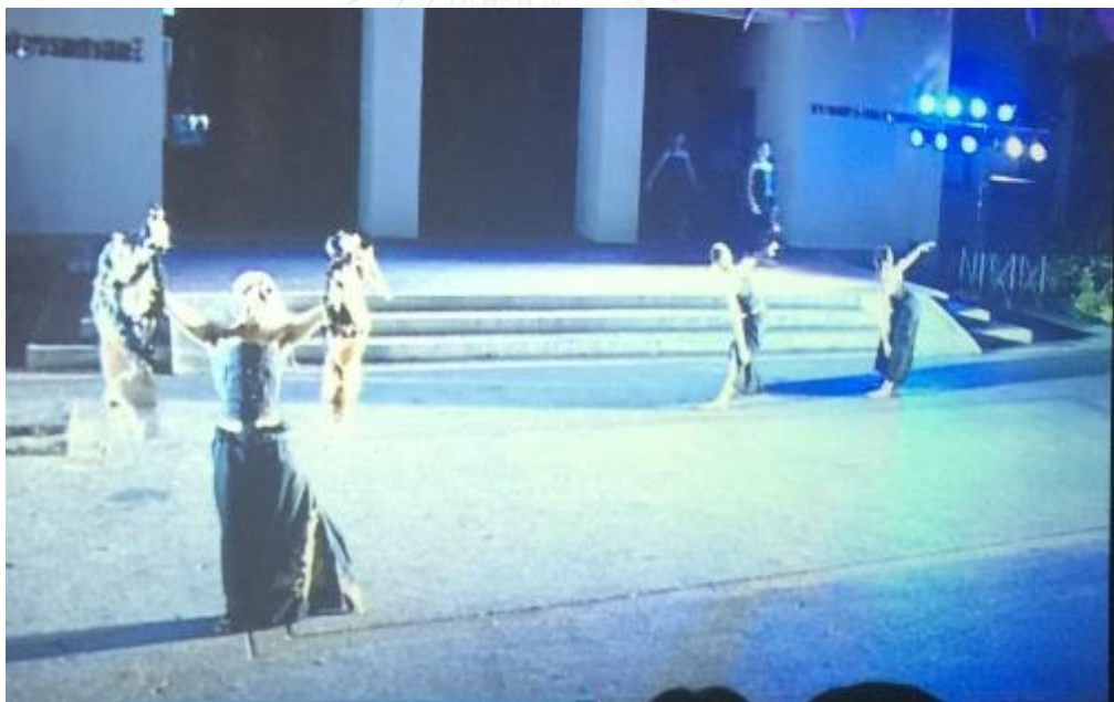
ภาพที่ 20 พระลอกคลั่ง