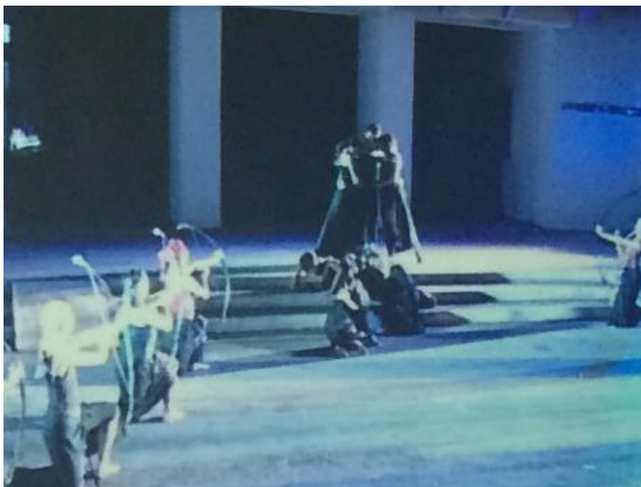
ภาพที่ 25 หุ่นสายพม่าที่ใช้เป็นสัญลักษณ์