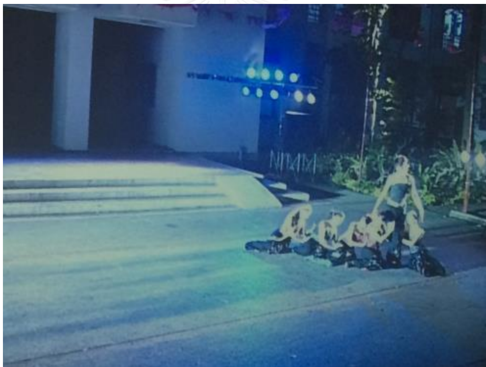
ภาพที่ 21 พระลอลาแม่ออกจากเมือง

จากภาพและคำสัมภาษณ์ผู้สร้างสรรค์ได้ปรากฏการใช้ ได้ปรากฏการใช้ทฤษฎีของ ศิลปะนามธรรม โดยผู้ชมจะต้องใช้เข้าถึงโลกของศิลปะหรือโลกของความงามที่แท้จริง โดยการตีความหรือดูการแสดงดังกล่าวนี้แล้วต้องคิดต่อยอด ตามประสบการณ์ของผู้ชมแต่ละคน นั่นคือสุนทรียะในการชมนาฏศิลป์ฉากนี้