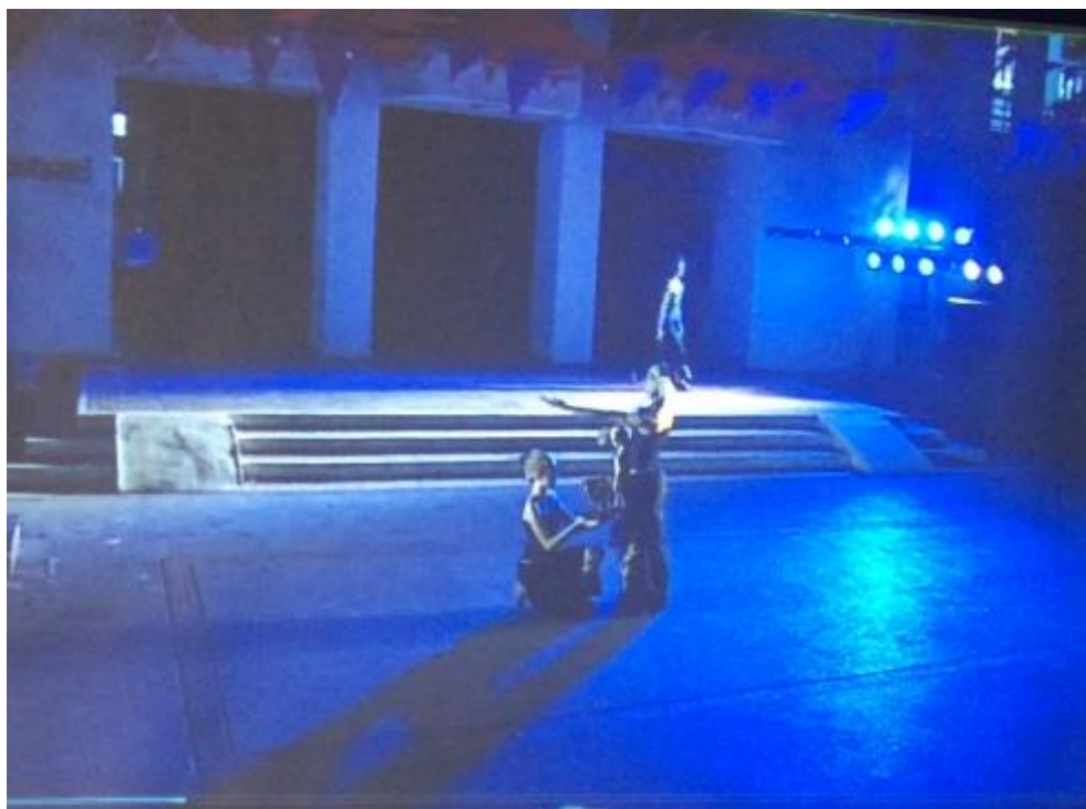
ภาพที่ 7 เล่าถึงเมืองสรอง