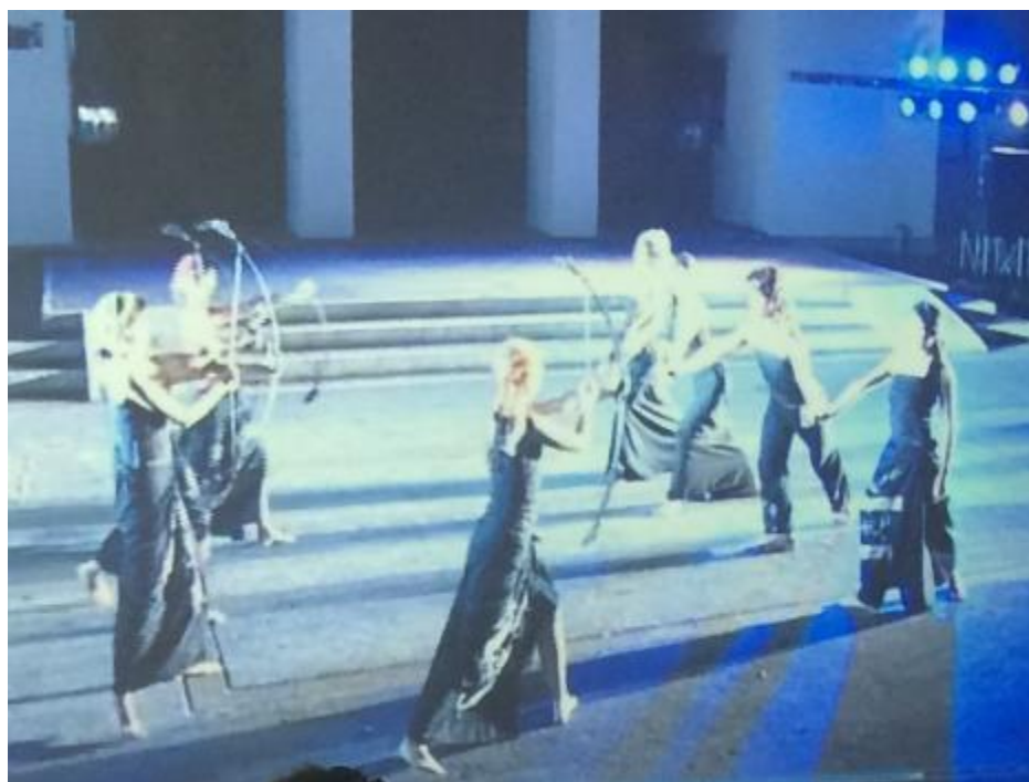
ภาพที่ 24 เจ้าคิดฆ่าพระลอ จุฬาลงกรณ์มหาวิทยาลัย ที่มา : นราพงษ์ จรัสศรี

จากภาพและคำสัมภาษณ์ผู้สร้างสรรค์ได้ปรากฏการใช้ทฤษฎีของศิลปะนามธรรม โดยผู้ชมจะต้องใช้เข้าถึงโลกของศิลปะหรือโลกของความงามที่แท้จริง โดยการตีความหรือดูการแสดงดังกล่าวนี้แล้วต้องคิดต่อยอด ตามประสบการณ์ของผู้ชมแต่ละคน คือสุนทรีย์ในการชมนาฏศิลป์ชุดนี้