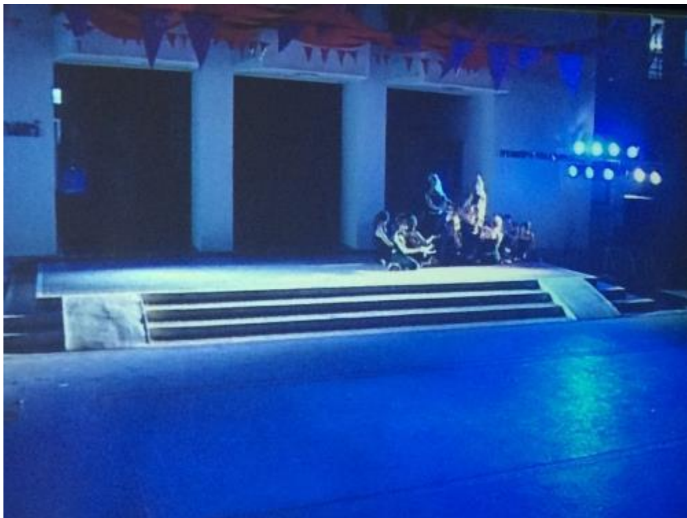
ภาพที่ 15 พี่เลี้ยงหาคณสรสรเสริญโถมพระเพื่อนพระแพง เพื่อเข้าเมืองแมนสรวง