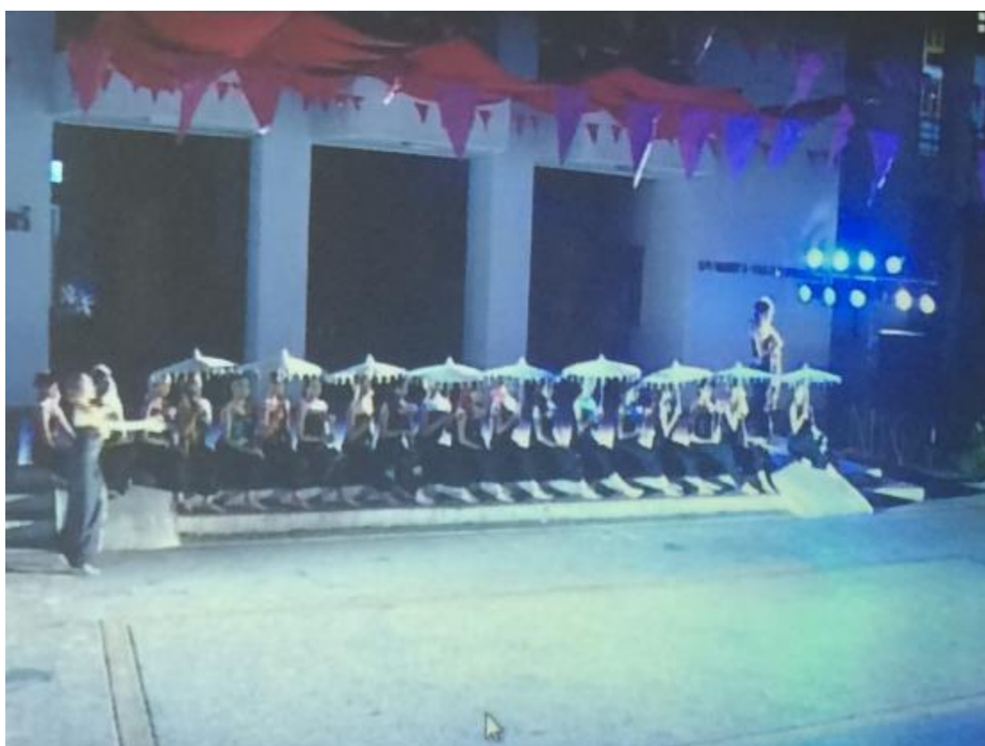
ภาพที่ 23 พระลอเสด็จประพาสไพร

จากภาพและคำสัมภาษณ์ผู้สร้างสรรค์ได้ปรากฏการใช้ ทฤษฎีของ ศิลปะยุคโพสโมเดิร์น ดันซ์ ศิลปะการจัดวาง และศิลปะนามธรรม อีกครั้งหนึ่ง เห็นได้จากการใช้สัญลักษณ์แก่วัฒนธรรม คือร่ม ซึ่งต่างยุคสมัยกันมาใช้สื่อถึงต้นไม้ พร้อมทั้งสร้างวัฒนธรรมทางเหนือไปด้วย ด้วยการจัดวางที่สวยงามอันหมายถึง เส้นทางที่มีสิ่งต่างๆระหว่างการเดินทาง