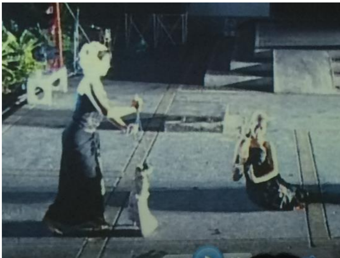
ภาพที่ 18 หุ่นสายพม่าที่ใช้เป็นสัญลักษณ์ของปู่เจ้า

มิติหนึ่ง เพื่อแสดงถึงความเป็นส่วนตัวของเจ้าหญิงที่อยู่ในที่รโหฐานของเจ้าหญิงเอง แต่เหล่านางกำนัลไม่สามารถเข้าใกล้ได้เหมือนพระพี่เลี้ยง