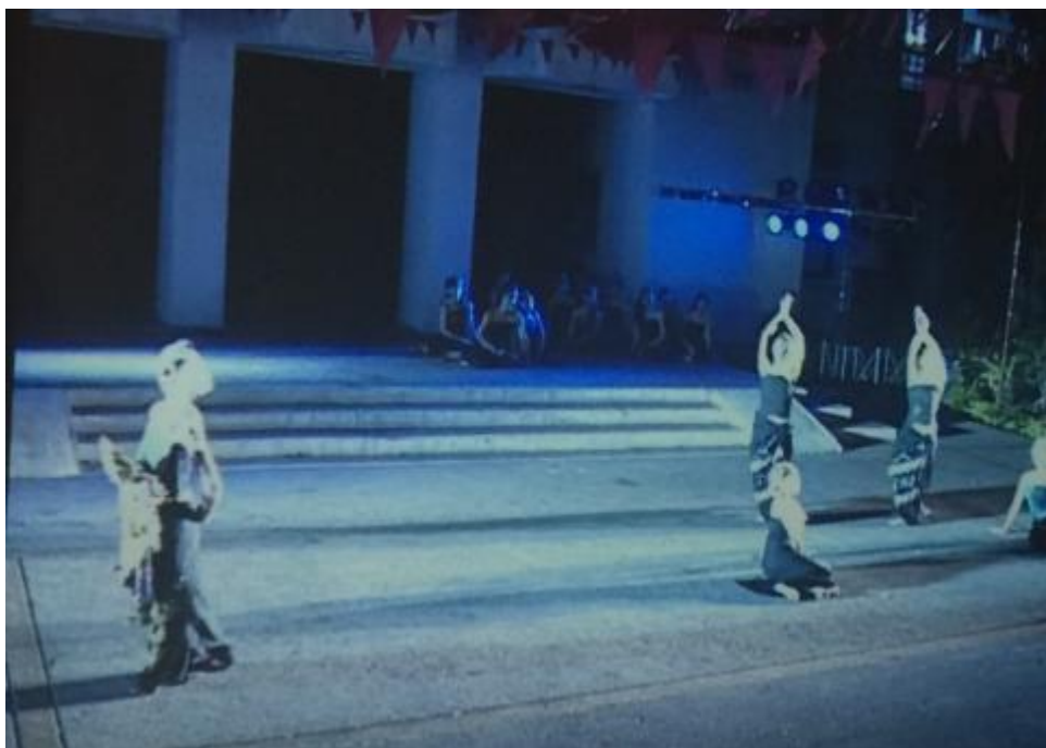
ภาพที่ 14 การใช้หุ่นพม่าเพื่อสร้างมิติในการแสดง

จากภาพและคำสัมภาษณ์ผู้สร้างสรรค์ได้ปรากฏการใช้ทฤษฎีของ ศิลปะยุคหลังสมัยใหม่ เนื่องจากใช้ท่ารำไทยและเพลงพื้นบ้านของภาคเหนือ มีการจัดองค์ประกอบศิลป์ เห็นได้ชัดจากการ จัดตำแหน่งของเจ้าหญิงและพี่เลี้ยง