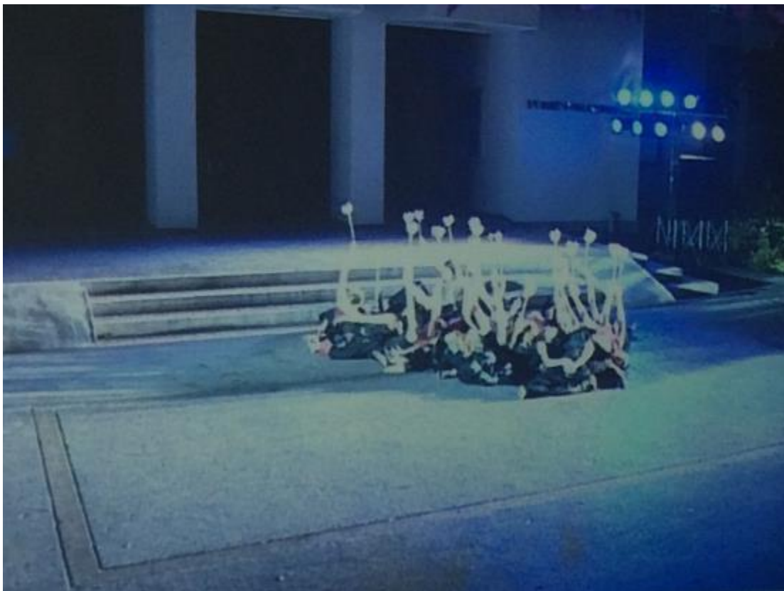
ภาพที่ 27 ดอกบัวสัญลักษณ์จักรธรรม