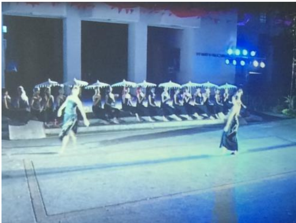
ภาพที่ 5 ร่มสัญลักษณ์แห่งวัฒนธรรมภาคเหนือ