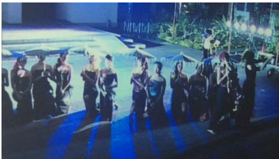
ภาพที่ 22 พระลอลาเสด็จประพาสไพร ถึง แม่น้ำกาหลง