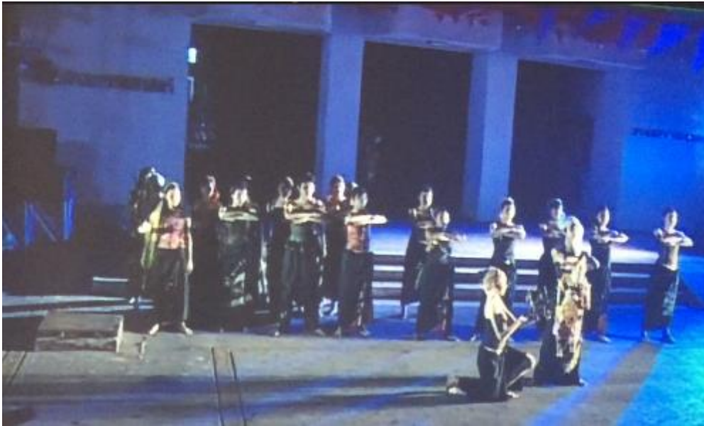
ภาพที่ 9 ท้าวแมนสรองยกทัพไปรบเมืองสรอง

จากภาพและคำสัมภาษณ์ผู้สร้างสรรค์ได้ปรากฏว่ามีการใช้ทฤษฎีของศิลปะยุคหลังสมัยใหม่ เนื่องจากใช้ยังปรากฏว่าใช้หุ่นสายพม่าเป็นสัญลักษณ์ของท้าวพิมพิสาครราชกษัตริย์แห่งเมืองสรอง ปรากฏท่าจีบ ในกลุ่มนักแสดงแล้วจัดองค์ประกอบของทำนอง เพื่อค่อยๆ เล่าเรื่องของครอบครัว ท้าวพิมพิสาครราช