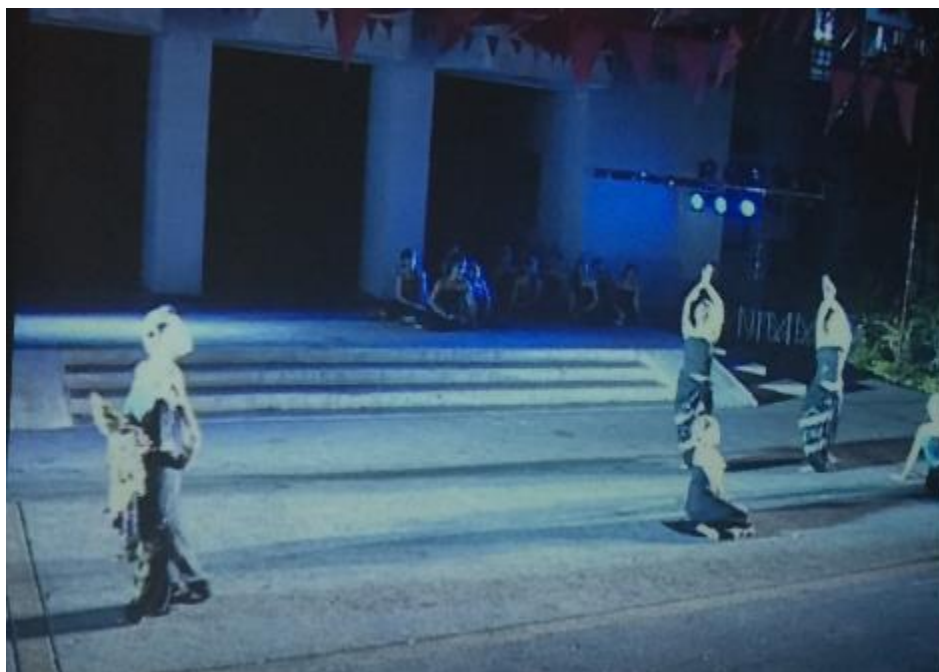
ภาพที่ 6 ฉากเปิดการแสดง