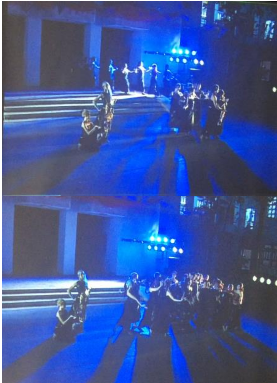
ภาพที่ 8 เล่าถึงเมืองสรองและเมืองแมนสรอง

ในบทเล่าถึงเมืองสรองก่อนที่จะกล่าวถึงการทำสงครามระหว่างเมืองแมนสรองกับเมืองสรอง นักแสดงค่อยๆ ออกมาหลอมกันเป็นกลุ่ม ด้วยท่าจิบง่ายของนาฏยศิลป์ไทยแล้วจัดองค์ประกอบทำนั่งแบบหมู่