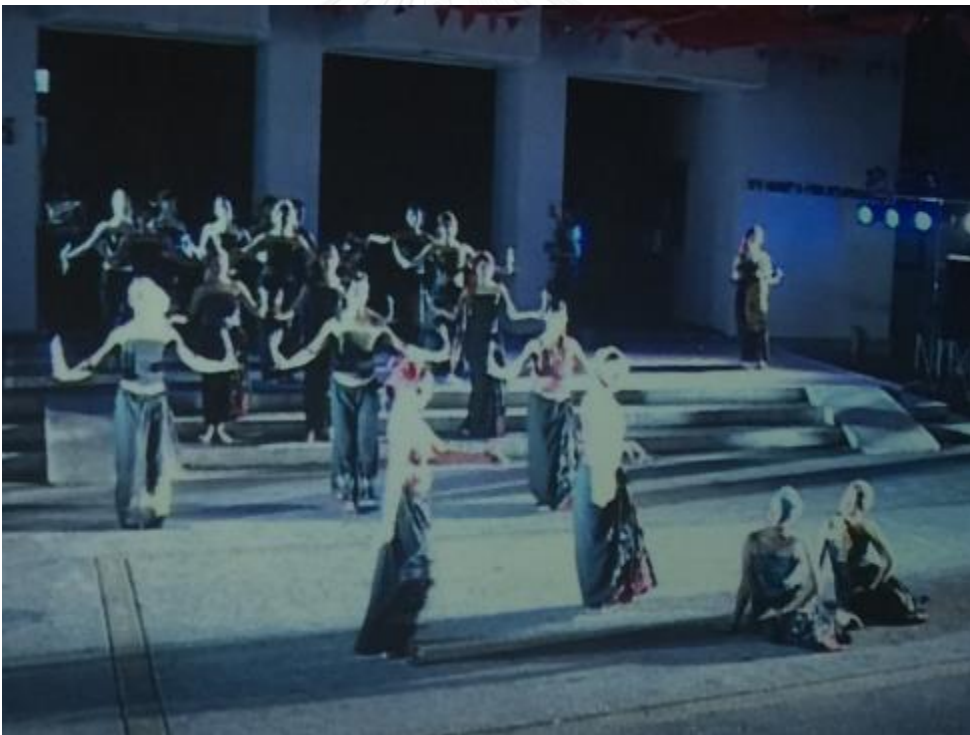
ภาพที่ 16 พี่เลี้ยงหาหมอทำเสน่ห์