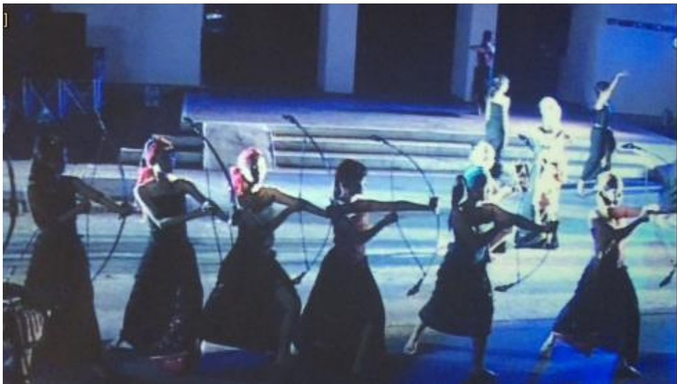
ภาพที่ 10 ท้าวแมนสรองยกทัพไปรบเมืองสรอง ใช้ธนูเป็นสัญลักษณ์ของสงคราม