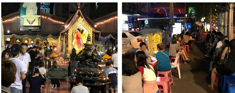
ภาพที่ 3 พื้นที่ดูดวงบริเวณสี่แยกห้วยขวาง รัชดาภิเษก

กลายเป็นทางแยกที่กำลังได้รับความนิยมจากคนไทยและชาวต่างชาติ นอกจากจะเป็นทางเข้าของตลาดห้วยขวางทั้งกลางวันและกลางคืน ที่แยกแห่งนี้ยังเป็นที่ตั้งของศาลพระพิฆเนศ สถานที่ศักดิ์สิทธิ์ของผู้มีจิตศรัทธาต้องมากราบไหว้บูชาเพื่อขอพรหรือโชคลาภอย่างไม่ขาดสาย สถานที่แห่งนี้จึงถือเป็นศูนย์รวมใหญ่ใจกลางเมืองของความเชื่อ และความศรัทธา นอกจากความศักดิ์สิทธิ์ขององค์พระพิฆเนศแห่งนี้แล้ว บริเวณด้านในพื้นที่ศาลและบริเวณโดยรอบจะสังเกตเห็นโต๊ะเล็กๆ วางตั้งเรียงรายอยู่รอบศาลอยู่เป็นจำนวนมาก ซึ่งจุดนี้กลายเป็นแหล่งรวมการพยากรณ์ของบรรดาหมอดูที่มีศาสตร์และเทคนิคเฉพาะตัว กว่า 20 โต๊ะ มีทั้งการทำนายโชคชะตาจากไพ่ยิปซี ผูกดวงกับวันเดือนปีเกิด หรือ ดูโหงวเฮ้ง มีให้เลือกสำรวจโชคชะตาตัวเองมากมายหลายศาสตร์ ซึ่งจะเห็นได้หลังจากช่วงเย็นๆหลังเลิกงาน ก็จะเริ่มมีผู้คนพลุกพล่านเดินอยู่เป็นจำนวนมาก ปะปนกับการตั้งโต๊ะดูดวงอยู่ริมฟุตบาท