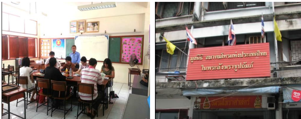
ภาพที่ 5 พื้นที่ดูดวงบริเวณสมาคมโหราแห่งประเทศไทย