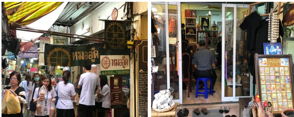
ภาพที่ 2 พื้นที่ดูดวงบริเวณตรอกวังหลัง