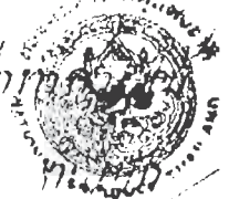
ภาพที่ ๑ ตัวอย่างเอกสารขอจดหมายเหตุแห่งชาติ รล.๘.๒ ค/๑ ต้นไม้ถนนราชดำเนิน และถนนต่างๆ.

ประมาณ ๑๖๔ อัฐิ เป็นเงิน ๔๐๑ บาท ถูกกว่าท้วย