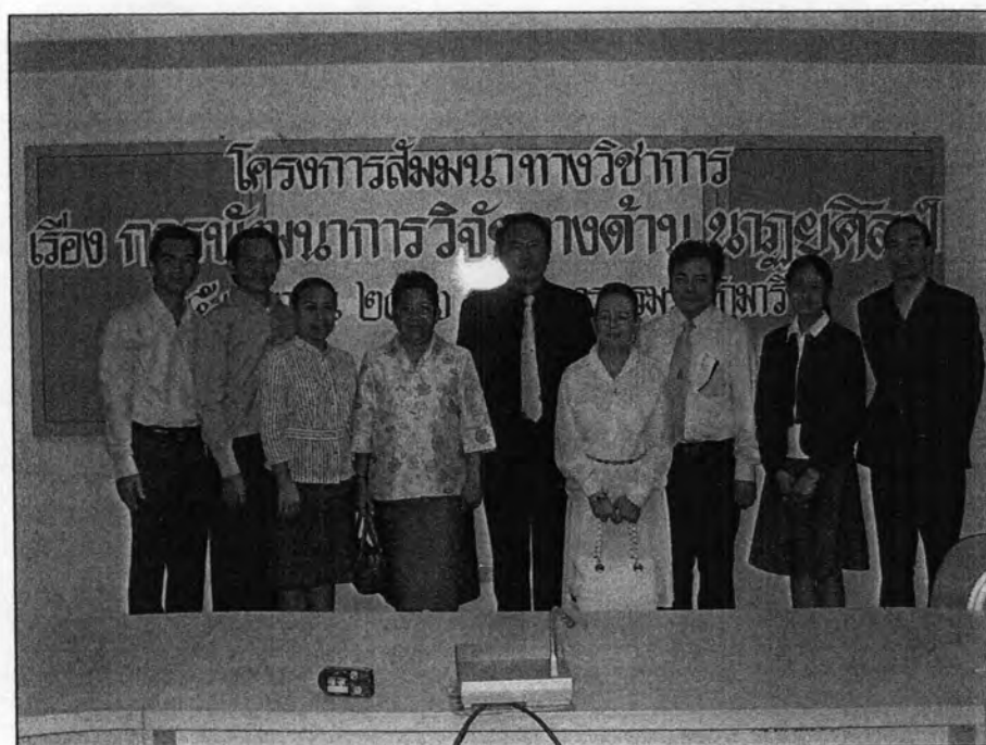
ผู้สัมมนาดำเนินการร่วมกับวิทยากรพิเศษ