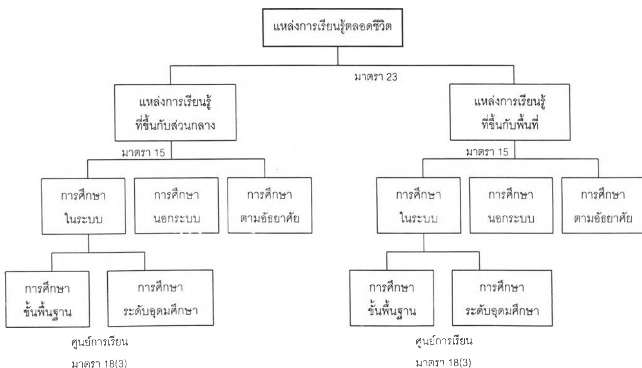
แผนภูมิที่ 3 แสดงความสัมพันธ์ระหว่างแหล่งการเรียนรู้ตลอดชีวิตกับการบริหารและการจัดการศึกษาของรัฐและระบบการศึกษา

แผนภูมินี้แสดงให้เห็นว่า ผู้เรียนสามารถเรียนรู้จากสถานศึกษาและแหล่งการเรียนรู้ตลอดชีวิตได้ตลอดเวลา แหล่งการเรียนรู้ตลอดชีวิต ดังกล่าว ได้แก่ ห้องสมุดประชาชน พิพิธภัณฑ์ หอศิลป์ สวนสัตว์ สวนสาธารณะ สวนพฤกษศาสตร์ อุทยานวิทยาศาสตร์และเทคโนโลยี ศูนย์การกีฬาและนันทนาการ แหล่งข้อมูลและแหล่งการเรียนรู้อื่น ส่วนสถานศึกษา ได้แก่ สถานพัฒนาเด็กปฐมวัย โรงเรียน ศูนย์การเรียนรู้ วิทยาลัย สถาบันมหาวิทยาลัย หน่วยงานการศึกษา หรือหน่วยงานอื่นของรัฐหรือของเอกชน ที่มีอำนาจหน้าที่หรือมีวัตถุประสงค์ในการจัดการศึกษา