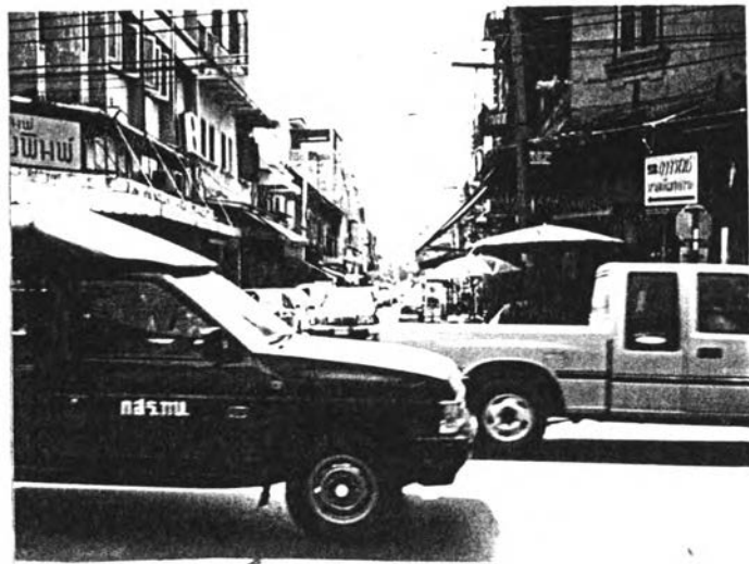
รูปที่ 5.4 สภาพตกรอก ขอย ในพื้นที่ แขวงบ้านพานถม