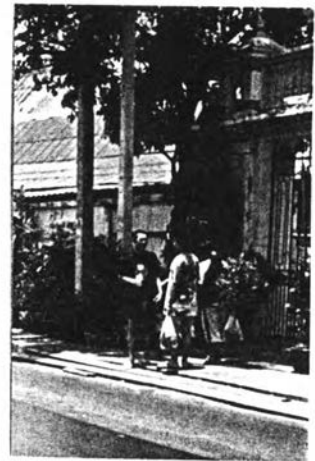
รูปที่ 5.1 สภาพทั่วไปของพื้นที่ศึกษา