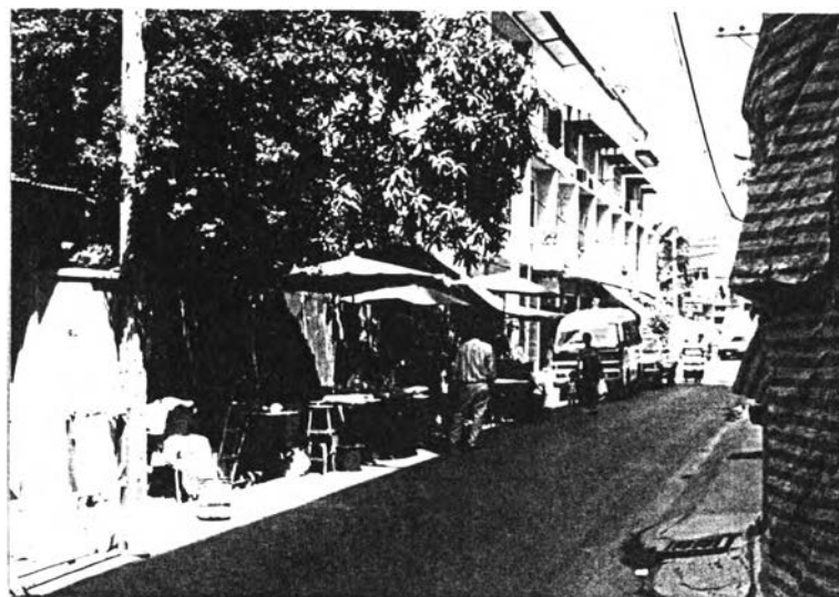
รูปที่ 5.2 สภาพชุมชนในพื้นที่แขวงวัดสามพระยา