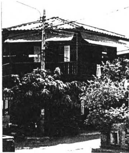
รูปที่ 5.3 สภาพชุมชนในพื้นที่แขวงบ้านพานถม