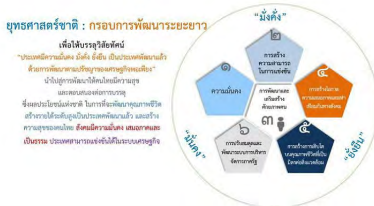
ภาพที่ 2.1 ร่างกรอบยุทธศาสตร์ 20 ปี

สาเหตุของการกำหนดกรอบยุทธศาสตร์ของชาติเพื่อแก้ปัญหาของการพัฒนาในระยะก่อน ผลการพัฒนาภาพรวมของประเทศได้รับการสนับสนุนที่ดีจากการรวมกลุ่มของประชาชนเป็น เครือข่ายเพิ่มมากขึ้น โดยการกำหนดยุทธศาสตร์ดังกล่าว ได้มีการนำความคิดเห็นและข้อเสนอแนะ