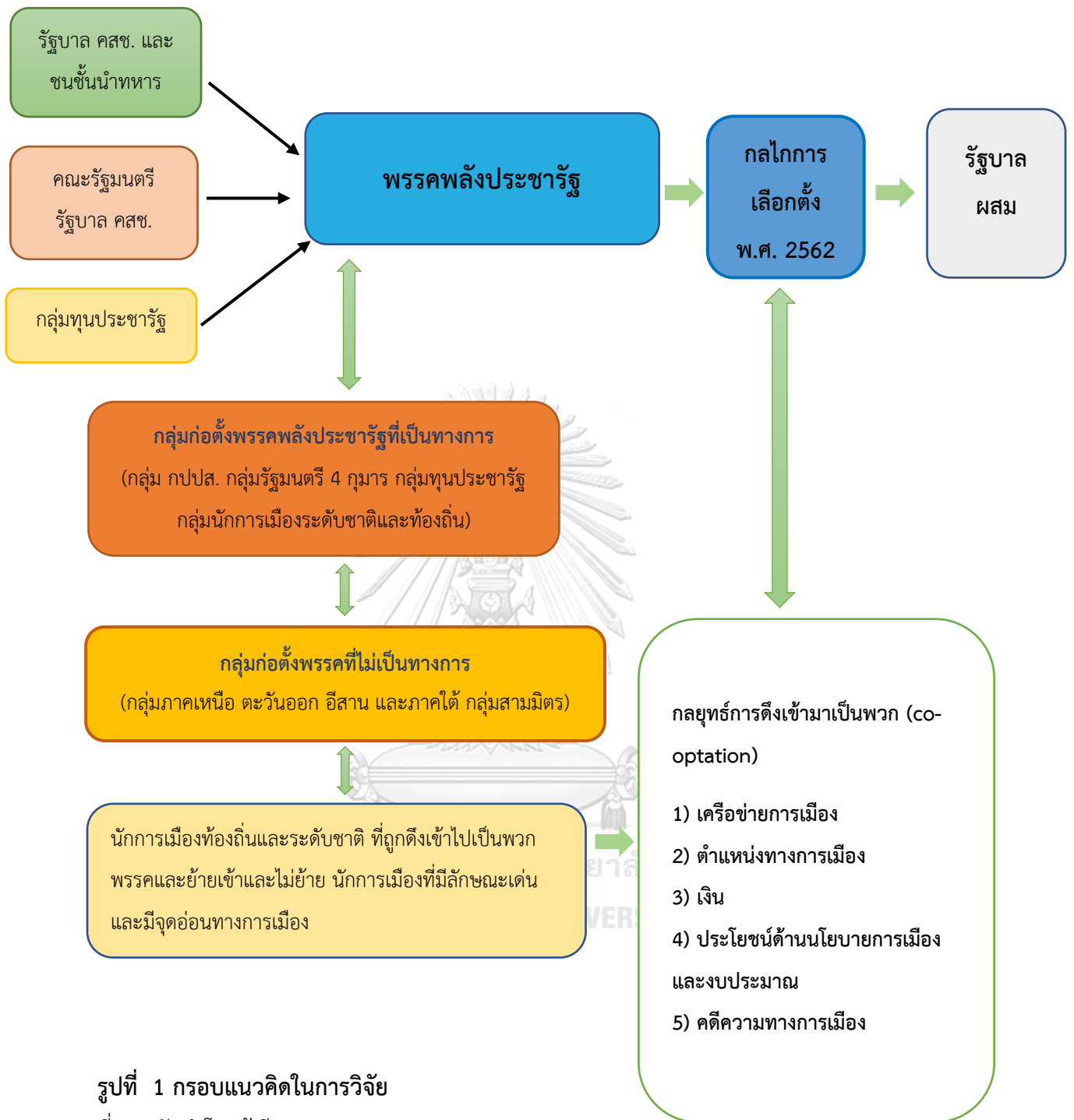
รูปที่ 1 กรอบแนวคิดในการวิจัย