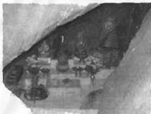
ภายในถ้ำปูอนันตนาคราชมีรูปปั้นปูอนันตนาคราช และปูมังกรขาว

๑.๒.๔ ถ้ำปูอนันตนาคราช หรือถ้ำปูใหญ่ เป็นที่ประทับของปูอนันตนาคราช และปูมังกรขาว ปูอนันตนาคราชเป็นพญานาค เชื่อกันว่าเป็นองค์เทพหรือเป็นครูบาอาจารย์ของพระชาตยณรงค์ ที่ตั้งของถ้ำอยู่หลังกุฎิของพระชาตยณรงค์ เล่ากันว่าสมัยก่อนบริเวณนี้จมอยู่ใต้ทะเล บริเวณนี้เป็นที่อยู่ของพญานาค ปูอนันตนาคราชเคยอาศัยอยู่ที่ถ้ำแห่งนี้ ร่องรอยดังกล่าวจะเห็นได้จากการที่หินในบริเวณวัดเป็นก้อนใหญ่และมีลักษณะเหมือนหินใต้ท้องทะเล บางคนจะมานับขานขอในเรื่องต่าง ๆ จากปูอนันตนาคราช หรือปูใหญ่นี้ เชื่อว่า ถ้าจะขอให้มียศหรือตำแหน่งที่ดี ๆ เล่ากันว่า หากผู้ใดไปสวดพระมาลัยในถ้ำนี้แล้วมองเห็นในผนังถ้ำว่ามีปูใหญ่ส่ายหัวอยู่ไปมา แสดงว่าผู้นั้นโชคร้าย มีบาปกรรมมาก บางครั้งมีผู้ได้ยินว่า ผู้ที่เข้าไปสวดพระมาลัยในถ้ำเป็นผู้หญิง แต่เมื่อฟังเสียงสวดที่สะท้อนออกมาออกถ้ำกลับได้ยินเสียงเป็นผู้ชาย จึงเชื่อว่าเป็นเสียงของปูที่มาร่วมสวดพระมาลัยด้วยกัน กล่าวกันว่าหากจะบนบานปูอนันตนาคราช ต้องแก้บนด้วยชมพู