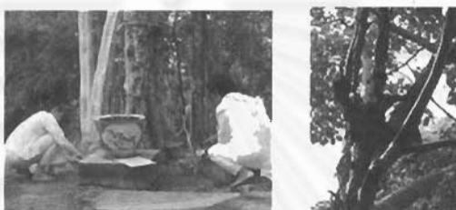
ผู้สวดพระมาลัยกรวดน้ำที่ต้นไม้อายุซึ่งเชื่อว่าสิ่งศักดิ์สิทธิ์ต่าง ๆ จะมารอรับส่วนบุญ

พระมาลัยไปนั้นก็อาจจะไม่ได้รับกุศลอย่างแท้จริง จากนั้น เมื่อหยาดน้ำลงพื้นก็ให้พูดว่า “สังฆาดัง โลกังกะวิฐ ลูกขอฝากซึ่งกุศล ผลแห่งบุญนี้ ที่ลูกได้ปรารถนาแล้วนี้ ให้ไปถึงซึ่งผู้ที่ลูกอุทิศไปแล้วนี้ทั้งหมดด้วยเทอญ ขออัญเชิญเทพเทวดา ๑๖ ชั้นฟ้า ๑๕ ชั้นดิน มารับรู้ในกิจบำเพ็ญบุญกรวดน้ำของข้าพเจ้า ฝากพระแม่ธรณีเป็นพยานด้วย ให้ถึงซึ่งผู้ที่ข้าพเจ้าได้อธิษฐานไปแล้วนี้ ให้สำเร็จ ให้สำเร็จ ให้สำเร็จ” หลังจากหยาดน้ำเรียบร้อยแล้วก็ป็นอันเสร็จสิ้นการสวดพระมาลัย ผู้สวดพระมาลัยก็จะไปเก็บอุปกรณ์ต่าง ๆ เข้าที่ให้เรียบร้อย หากผู้ใดต้องการสวดพระมาลัยต่อไปอีก ก็จะต้องย้อนกลับไปปฏิบัติตั้งแต่ขั้นตอนที่ ๑ และหากพระคัมภีร์ที่อธิษฐานเลือกมาอ่านยาก ติดขัด ก็สามารถอธิษฐานเลือกพระคัมภีร์เล่มใหม่ได้