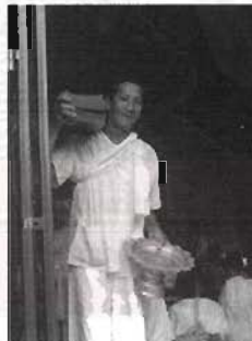
ผู้สวดอัญเชิญพระคัมภีร์บนบ่าเมื่อจะนำไปยังที่ต่าง ๆ

ผู้สวดพระมาลัยส่วนใหญ่จะมาอธิษฐานเลือกพระคัมภีร์พระมาลัยในอุโบสถ และอาจสวดพระมาลัยที่พระอุโบสถหรือตามสถานที่ศักดิ์สิทธิ์ต่าง ๆ ในสำนักสงฆ์ถ้าเม่นตามที่ใดกล่าวถึงแล้วข้างต้นก็ได้ ผู้สูงอายุที่ไม่สามารถขึ้นเขามายังพระอุโบสถ ก็อาจใช้พระคัมภีร์ซึ่งมีไว้ให้จำนวนหนึ่งตามศาลและถ้าศักดิ์สิทธิ์ต่าง ๆ เมื่อเลือกพระคัมภีร์และอัญเชิญพระคัมภีร์ขึ้นบนบ่าและนำไปวางบนโตะวางพระคัมภีร์เรียบร้อยแล้ว ก็จะเริ่มสวดพระมาลัยโดยดำเนินตามขั้นตอนต่าง ๆ ดังนี้