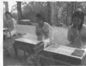
พระคัมภีร์พระมาลัยในพระอุโบสถ ผู้สวดพระมาลัย และอุปกรณ์ที่ใช้ในการสวด