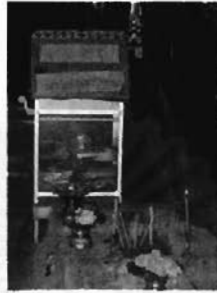
แผ่นหินสี่เหลี่ยมที่ประดิษฐานหลวงตาหรือพระศพของพระอรหันต์

๑.๒.๙ หลวงตา มีลักษณะเป็นแผ่นหินรูปสี่เหลี่ยมผืนผ้า อยู่ระหว่างแม่สมุทและพระนางเรือล่ม เชื่อกันว่าเป็นที่ละสังขารหรือที่ประดิษฐานพระศพของพระอรหันต์ เรียกกันว่า "หลวงตา" บ้าง "ปู้ฤาษี" บ้าง