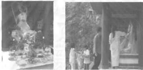
แม่พระธรณีและการทำพิธีห่มผ้าแม่พระธรณี

๑.๒.๒ ศาลแม่พระธรณี เป็นศาลที่อยู่ข้างศาลหลวงปู่เจ้าวัด เป็นที่ประทับของแม่พระธรณี เชื่อกันว่า คนที่ทำแท้งจะต้องทำพิธีห่มผ้าแม่พระธรณีจึงจะแก้บาปได้ การห่มผ้าแม่พระธรณี เป็นการฝากให้แม่พระธรณีนำเด็กที่ถูกทำแท้งไปเกิดในชาติภพใหม่ ผ้าที่ห่มถวายแม่พระธรณีนั้นต้องเป็นชุดไทยสไบเฉียง และห้ามถวายชุดสีแดงเด็ดขาด ส่วนใหญ่มักจะถวายสีเหลือง ชมพู เขียว ขาวหรือดรัม