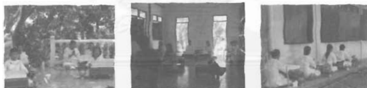
ผู้สวดพระมาลัยขณะสวดที่บริเวณพระอุโบสถและพระธาตุเจดีย์