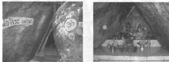
ทางเข้าถ้ำพระศิวะและแท่นที่บูชาภายในถ้ำ

๑.๒.๑๑ ถ้ำพระศิวะ เป็นที่ประทับของพระศิวะ พระอุมา พระคเณศ และพระขันตกุมาร ถ้ำแห่งนี้เป็นสถานที่ศักดิ์สิทธิ์ที่อยู่ไกลกว่าสถานที่ศักดิ์สิทธิ์อื่น ๆ ผู้ที่มากกราบไหว้เป็นประจำมักเป็นผู้ที่มีองค์ทางแขกซึ่งเกี่ยวข้องกับเทพทั้ง ๔ องค์นี้ ในการบูชาหรือบนบานที่ถ้ำพระศิวะ จะบูชาด้วยผลไม้ ๕ อย่าง นม และพวงมาลัยดาวเรือง