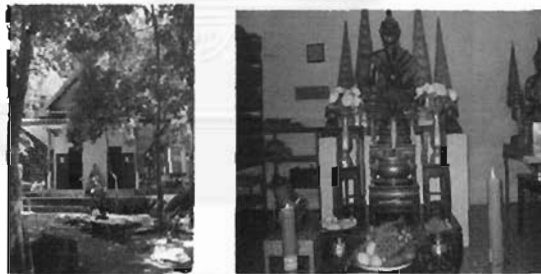
บริเวณนอกพระอุโบสถและพระประธาน

๑.๒.๖ พระอุโบสถ ตั้งอยู่สูงเหนือขึ้นไปจากศาลปู่เจ้าวัด ศาลแม่พระธรณี ภูมิหลวงดาซุน ถ้ำปู่อนันตนาคราช และถ้ำปู่โสม ข้างพระอุโบสถเป็นที่ประดิษฐานพระธาตุเจดีย์ ภายในพระอุโบสถมีพระประธาน พระโมคคัลลาน์ พระสารีบุตร และเป็นที่เก็บรวบรวม “พระคัมภีร์” หรือ “คัมภีร์สวดพระมาลัยฉบับล.ธรรมภักดี” และอุปกรณ์อื่น ๆ ที่ใช้ในการสวดพระมาลัย ผู้สวดพระมาลัยส่วนใหญ่จะสวดพระมาลัยกันภายในพระอุโบสถนี้ บางคนเชื่อว่า ได้พระอุโบสถแห่งนี้มีพระพุทธรูปเจ้าห้าพระองค์ประดิษฐานอยู่ และเชื่อว่าหลังพระอุโบสถแห่งนี้ คือ ประตูเมืองลับแลเก่าอีกด้วย