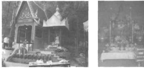
วิหารหลวงปู่เจ้าวัดหลังใหม่และแท่นบูชา ข้างวิหารหลวงปู่เจ้าวัดคือศาลแม่พระธรณี

๑.๒.๒ ศาลแม่พระธรณี เป็นศาลที่อยู่ข้างศาลหลวงปู่เจ้าวัด เป็นที่ประทับของแม่พระธรณี เชื่อกันว่า คนที่ทำแท้งจะต้องทำพิธีห่มผ้าแม่พระธรณีจึงจะแก้บาปได้ การห่มผ้าแม่พระธรณี เป็นการฝากให้แม่พระธรณีนำเด็กที่ถูกทำแท้งไปเกิดในชาติภพใหม่ ผ้าที่ห่มถวายแม่พระธรณีนั้นต้องเป็นชุดไทยสไบเฉียง และห้ามถวายชุดสีแดงเด็ดขาด ส่วนใหญ่มักจะถวายสีเหลือง ชมพู เขียว ขาวหรือดรัม