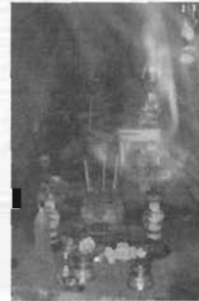
บริเวณที่ประทับของแม่สมุทรหรือแม่เมขสมุทร